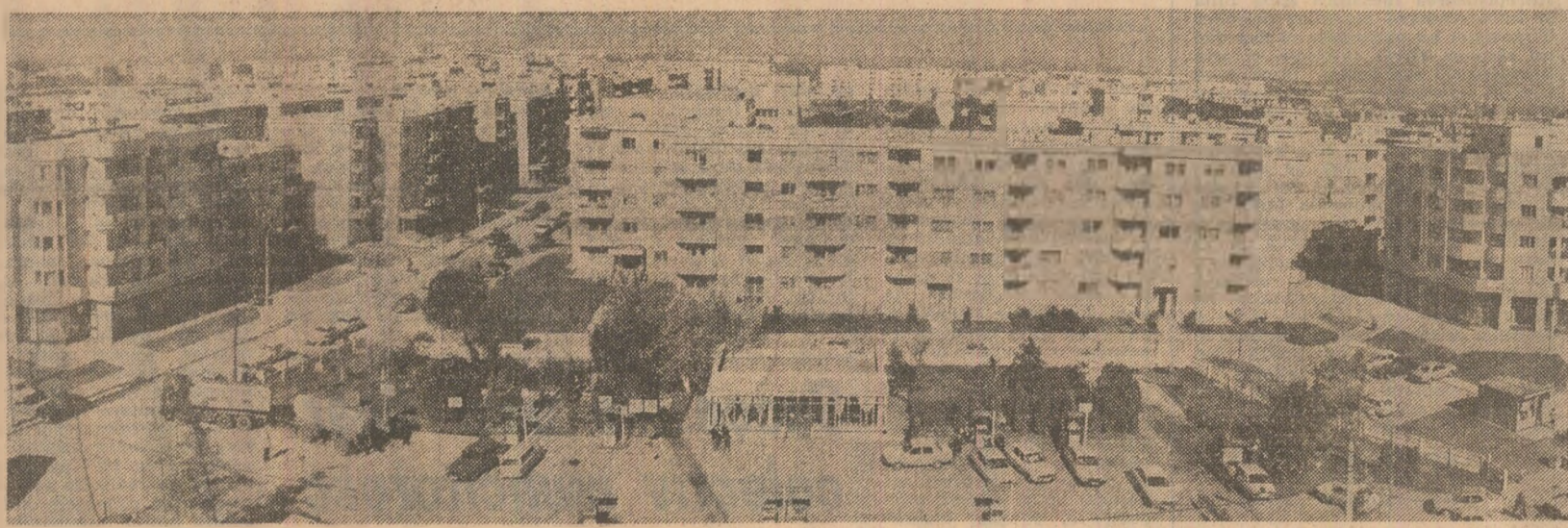
În lumina orientărilor recente ședința a Comitetului Politic Executiv al C.C. al P.C.R.