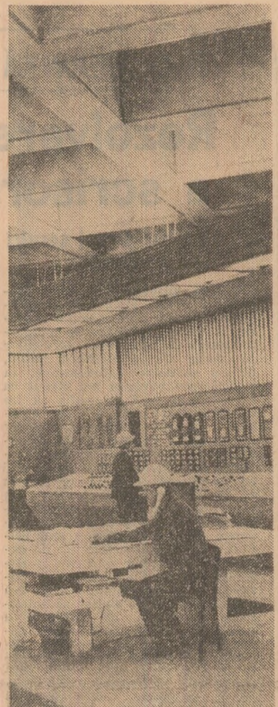
In camera de comandă a Centralei electrice de pe platforma industrială Chișcani, județul Brăila, urmărirea atentă a parametrilor pentru funcționarea agregatelor la capacitatea maximă.