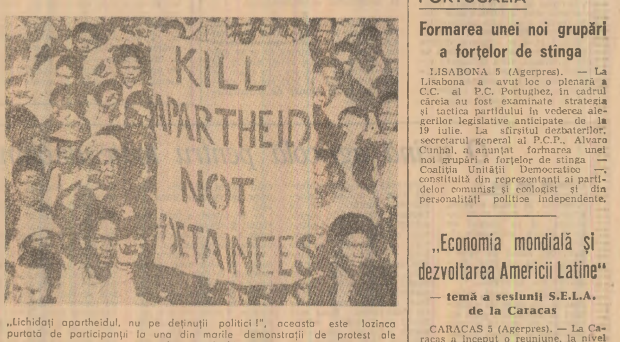
„Lichidați apartheidul, nu pe deținutul politici!”, aceasta este lozincă purtată de participanții la una din marile demonstrații de protest ale populației sud-africane