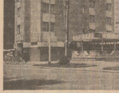
UNITĂȚI TURISTICE ÎN JUDEȚUL ARAD

Sub semnul colaborării rodnice, multilaterale, în interesul socialismului și păcii