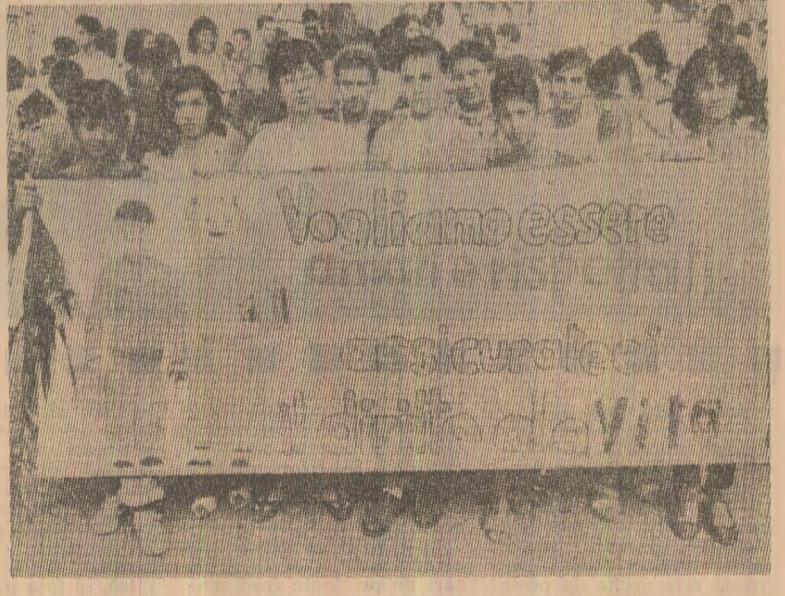
„Dorim să fim ocrotiți și respectați; asigurăți-ne dreptul la viață”. Sub această lozincă, mii de tineri au participat la Palermo la o demonstrație pentru pace, pentru eliberarea Siciliei și a întregii Europe de arme nucleare

la Comiso — unde se află dislocată racheta nucleară cu rază medie de acțiune. Tot în acest cadru, președintele Adunării regionale siciliene a cerut guvernului să promoveze o Conferință internațională pentru pace în Mediterana, acțiune care ar putea să se desfășoare chiar la Palermo. „Întreaga Sicilie” — se spune în mesajul adresat primului ministru — „și-a exprimat deja la nivel instituțional, cit și prin mari manifestări populare voința sa de pace și opoziția fermă față de armamentul nuclear”. O inițiativă aparte au lansat și mișcările pacifiste și ecologiste din Sardinia, cărora li s-au alăturat și unele organizații de tineret și coloziale, precum și numeroase personalități ale lumii culturale și științifice. Astfel, s-a propus organizarea unui referendum la nivel regional în legătură cu prezenta submarinelor nucleare americane în apele siciliene și în special, în insula La Maddalena. Pentru inițierea referendumului este necesară strângerea a cel puțin 10.000 de semnături, care sînt acum în curs de colectare. Reprezentanții a numeroase forțe politice, oameni de știință, parlamentari au criticat, în repetate rânduri, în ultimele luni, aderearea Italiei la proiectul american cunoscut sub numele de „războiul stelelor”. Cunoscutul om de știință italian