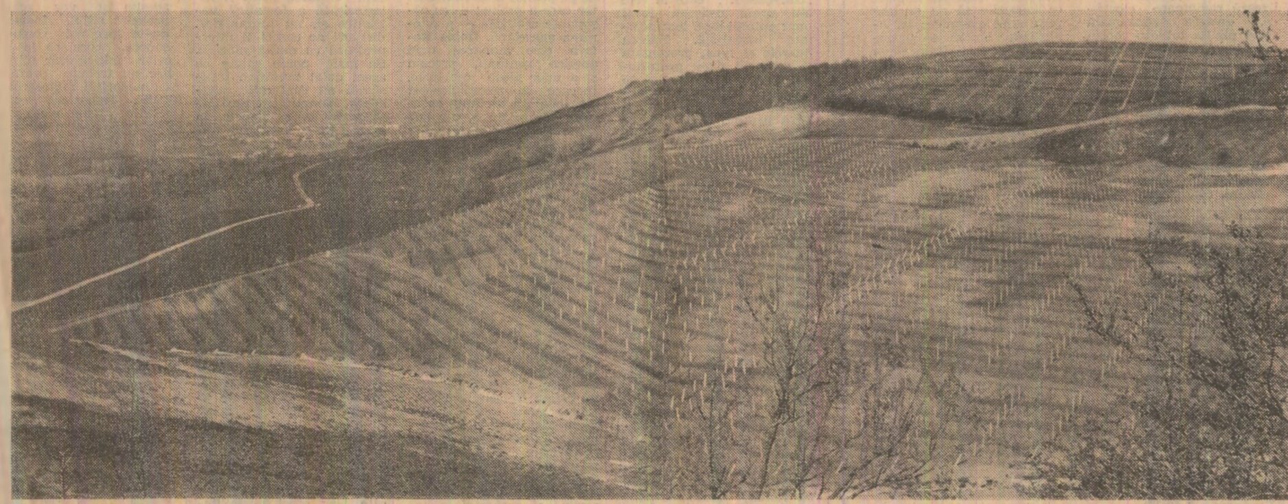
În bazinul viticol Husi, județul Vaslui, versanții unor dealuri improprie pentru culturile agricole au fost amenajați în moderne plantații de vie