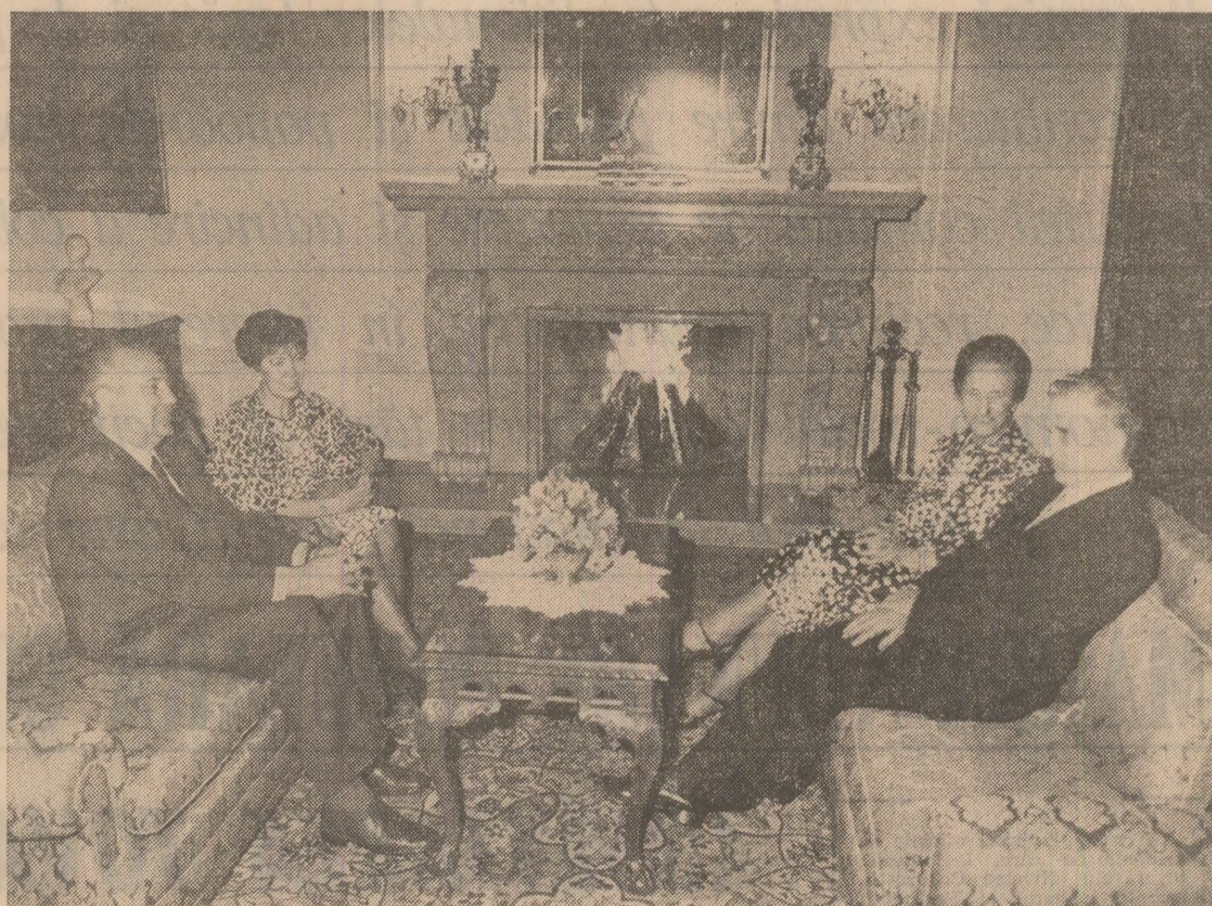
Tovarășul Nicolae Ceaușescu, secretar general al Partidului Comunist Român, președintele Republicii Socialiste România, împreună cu tovarășa Elena Ceaușescu, au oferit, marti, un dineu în onoarea tovarășului Mihail Gorbaciov, secretar general al Comitetului Central al