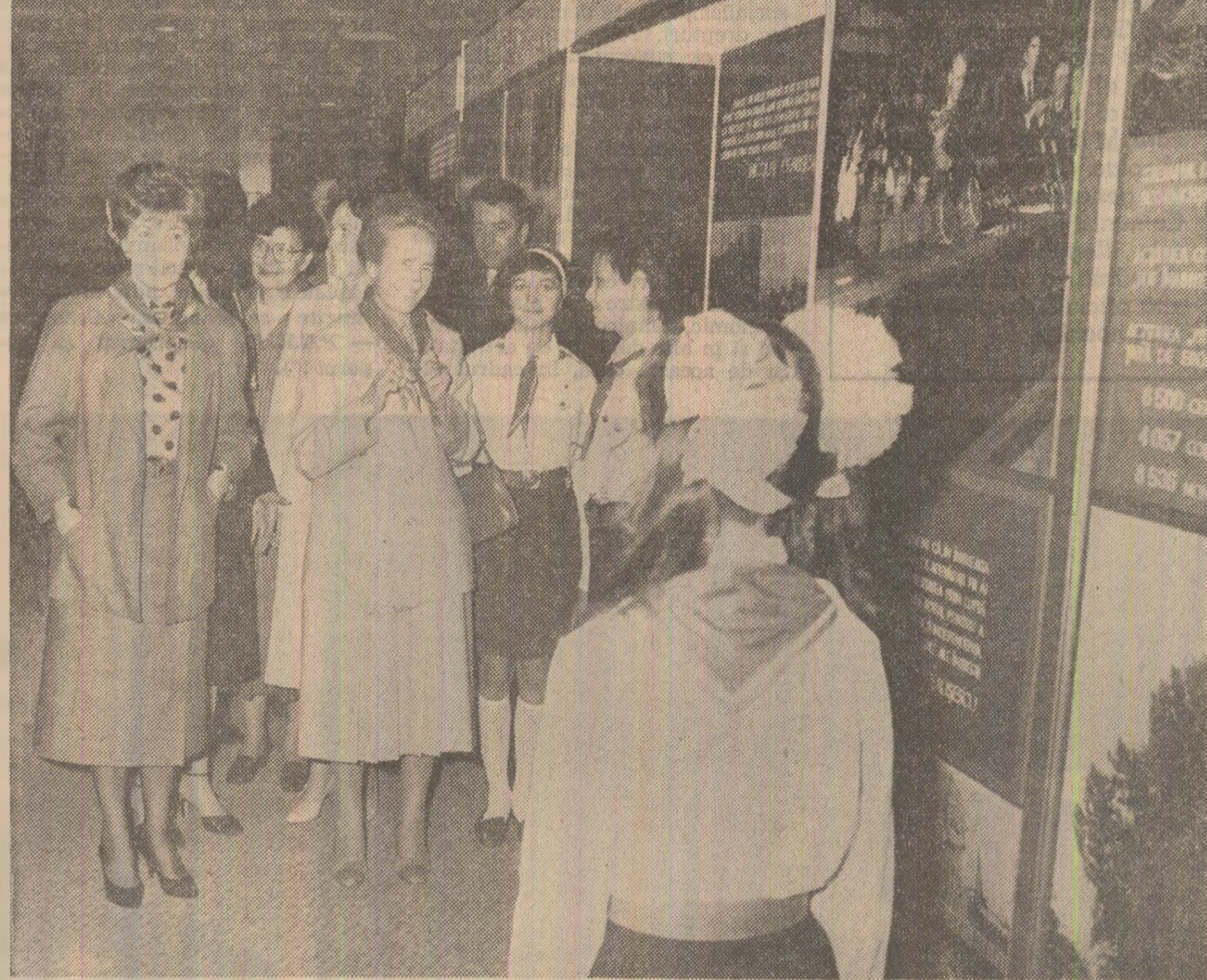
Tovarășa Elena Ceaușescu și tovarășa Raisa Gorbaciova au fost, marti dimineața, oaspeți ai Palatului pionierilor și șoimilor patriei.