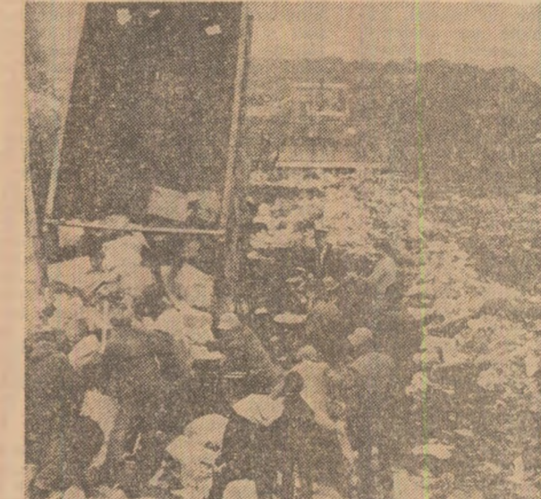
O imagine ce poate fi adesea întâlnită la periferia marilor orașe occidentale: șomeri scotocind prin rampele de gunoi (fotografie din suplimentul ilustrat al săptămînalului „Observer”).

● „Adevărul trist — scria ziarul „DIE WELT” — este că drepturile și șansele în viață ale unei persoane din țările cele mai dezvoltate, care se consideră și cele mai democratice, depind în ultimă instanță de avere, de bani. Candidații de la virful piramidei sociale sînt „aleși” naștîni, deși în realitate ei sînt aleși banilor lor. Cît privește pe cei alinați de „virulul sărăciei”, aceștia sînt plasați la periferia societății. Aceste cohorte de pauperi, lumea de la baza scării sociale, sînt practic lipsite de drepturi și de orice șanse în viață. Aceștia nici măcar nu-și pun problema să participe la vot, fără a se mai pune problema de a fi aleși, într-otîi sînt preocupăți de ziu de azi și de cea de mîine”.