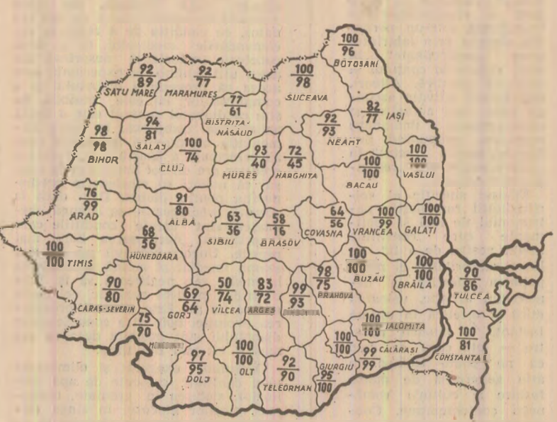
STADIUL LUCRĂRILOR DE ÎNTREȚINERE LA PORUMB. Cifrele înscrise pe hartă reprezintă în procente pe județe, în seara zilei de 5 iunie, proporția în care a fost efectuată prima prașilă mecanică la porumb (cifra de sus) și cea manuală (cifra de jos). Date furnizate de Ministerul Agriculturii.