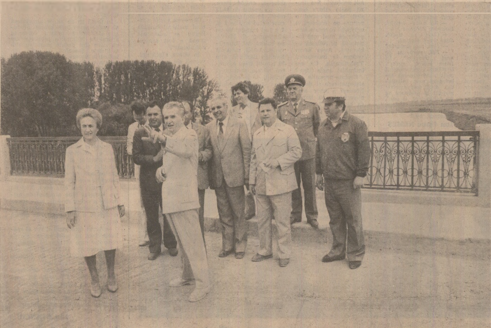
Tovarășul Nicolae Ceaușescu, secretar general al Partidului Comunist Român, președintele Republicii Socialiste România, împreună cu tovarășa Elena Ceaușescu, a efectuat, sâmbătă, 6 iunie, o vizită de lucru la noi obiective și pe mari șantiere de construcții edilitare din Capitală.

Această vizită a pus încă o dată în lumină atenția deosebită pe care secretarul general al partidului o acordă dezvoltării și modernizării Capitalei, a tuturor localităților patriei, înfăptuiri unor proiecte de amploare, semnificative pentru glorioasă epocă ce o trăiește țara noastră. Lucrările de arhitectură monumentală, de larg interes social-edilitar și cetățenesc ce se realizează în București vor conferi o nouă și strălucită înfățișare celui mai puternic centru politic, economic, administrativ și social-cultural al patriei noastre socialiste. Noile clădiri vor contribui la înfrumusețarea Capitalei, întinzând armonios vasta activitate de construcție și sistematizare desfășurată în anii socialismului, începând în perioada inaugurată de Congresul al IX-lea al partidului. Aceste obiective îndrăznețe, de proporții ce ilustrează forța și capacitatea creatoare a poporului nostru, vor fi realizate în mod constructiv, s-au înfăptuit și se înfăptuiesc sub direcția îndrumare a tovarășului