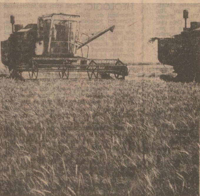
În zonele de cîmpie ale țării, secerișul a atins acum perioada de vîrf. Imediat după combine oamenii adună paie, creînd front larg de lucru mecanizatorilor care lucrează la pregătirea terenului și la însămintarea celei de-a doua culturi.

ta în magazii. Cantitățile de grâu cu umiditatea peste normativ sînt depozitate temporar pe pistă pentru solarizare. La capătul pistierilor sînt pregătite prelate care se folosesc în caz de ploșie”. Revenim la puncta de intrare în incinta bazei, la cîntar, și recurgem la o recepție sumară a mijloacelor de transport, mai exact — urmărirea stării de etanșeitate a acestora. Mașinile și remorcile cu emblema întreprinderii județene de transport auto nu au prezentat nici o defecțiune. Fiecare camion auto era dotat și cu o trusă de materiale care să fie folosite în eventualitatea apariției unor locuri prin care să se piardă pe drum boabele de grâu. Bine pusă la punct s-au prezentat și mijloacele de transport ale cooperativei agricole Vinăroș, Milcovul și altele. Constatăm și unele improvizații la re-