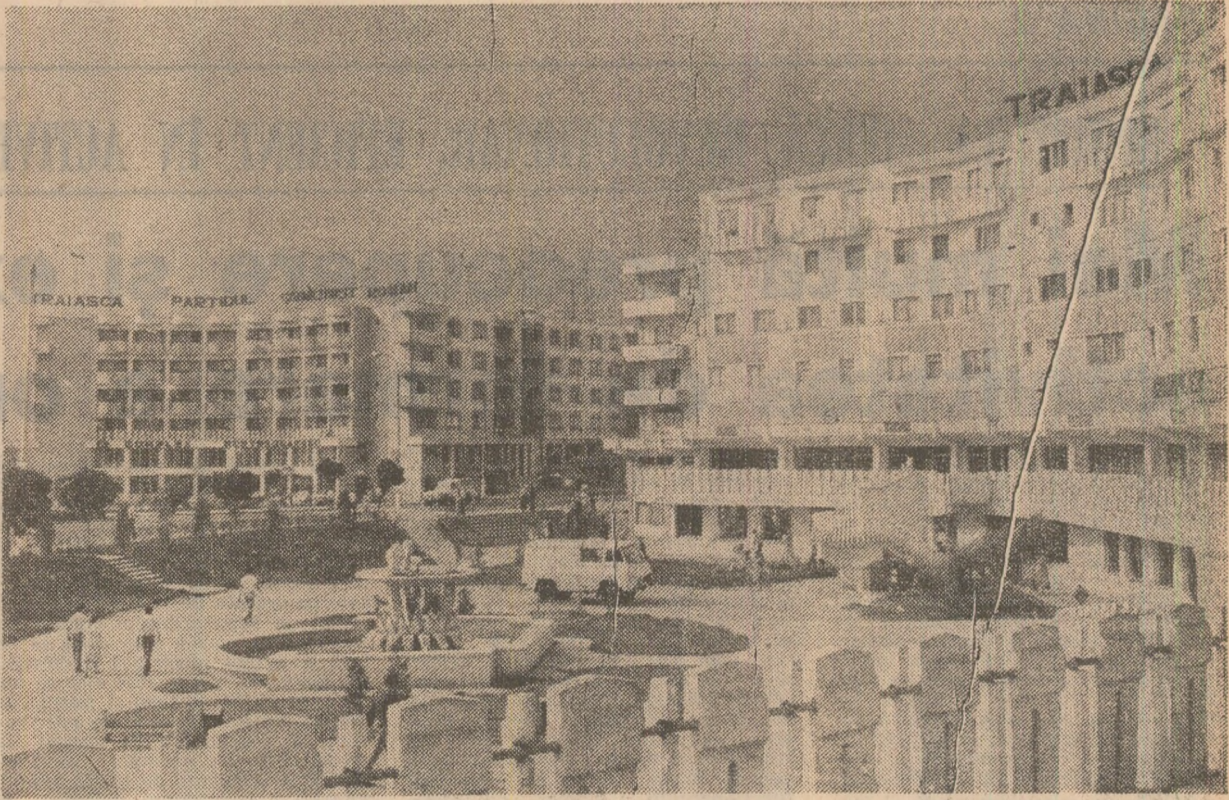
Dim noua arhitectură a orașului Roman, județul Neamț.

de la Dunării de Jos, cu sediul la Galați. Am scris acolo nu o dată, ci de nenumărate ori, dar nu am primit nici un fel de răspuns, ca să nu mai vorbesc de actul co-mi este necesar”. Corespondentul atașează scrisorile și citeva necipse din 1986, apoi din 1987, una chiar cu confirmare de primire. Însă