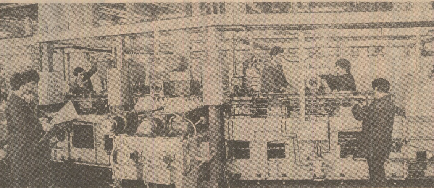
În aceste zile pregătitoare mării sărbători naționale de la 23 August, în secția montaj generală a Întreprinderii de mașinării și agregate din Capitală echipele de făcături-montori lucrează non-stop la finalizarea unor instalații și agregate deosebit de complexe destinate beneficiarilor interni și exportului. Sînt instalații concepute după proiecte întocmite în cadrul I.C.S.I.T. „Titan” București și realizate integral cu componente românești. Unul dintre aceste produse — agregat pentru prelucrarea contragreutăților pompelor de injecție (în fotografie) — destinat Întreprinderii de mecanică fină din Sinaia, va fi livrat beneficiarului cu zece zile în avans. La baza acestui succes se află aplicarea unor tehnologii noi, moderne, care au permis scurtarea ciclurilor de montaj.