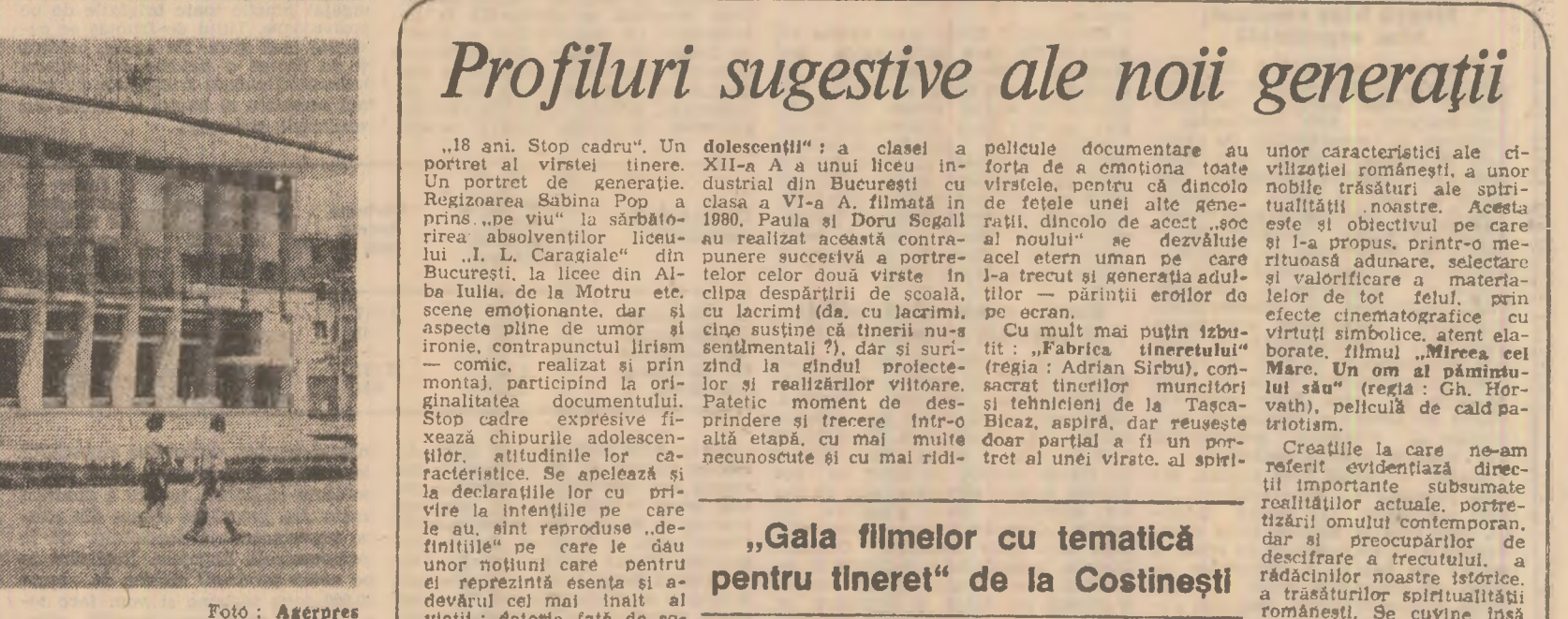
Casa de cultură din Suceava