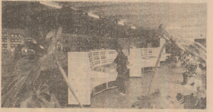
Combinatul de fibre sintetice Săvinești. Imagine din noua secție, Melanț V, intrată în producție în acest an.

„În ciclul de articole publicate pînă acum cu privire la efectuarea lucrărilor de reparații, modernizării la instalările din termostate și de investiții pe sanitarizarea noilor obiective energetice s-a rugat practic cu regularitate problema asigurării utilajelor. Cele mai multe semnale au fost adresate întreprinderii „Vulcan” București. Pe santierul termostaterelor Holboca — Iași, Drobeta-Turnu Severin, Suceava și Brașov, unde e prevăzută în acest an intrarea în funcțiune a unor grupuri energetice, lucrările de montaj se mențin la un nivel scăzut datorită lipsei unei cantități importante de echipamente care trebuia livrate de întreprinderea „Vulcan”. La termostatele Turcești și Rovinari se află în curs de modernizare trei grupuri de cîte 330 MW, lucrări care sînt afectate de neajunsurile termen a sute de