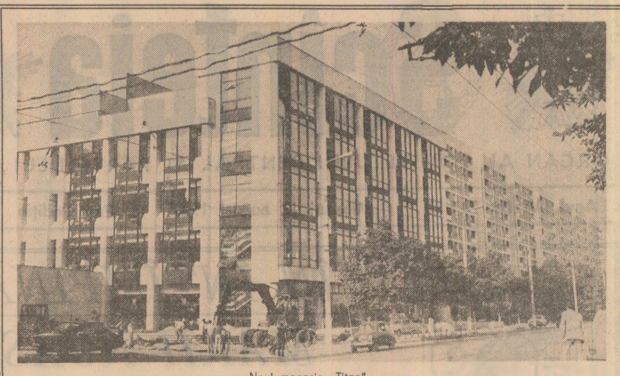
Noul magazin „Titan”