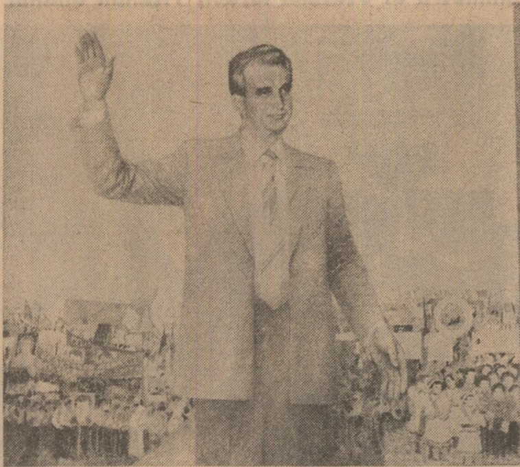
Lucrări de Vasile Pop Negreșteanu