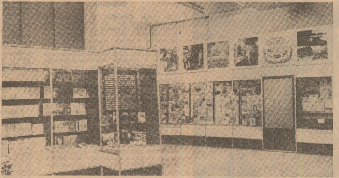
Imagine din expoziție