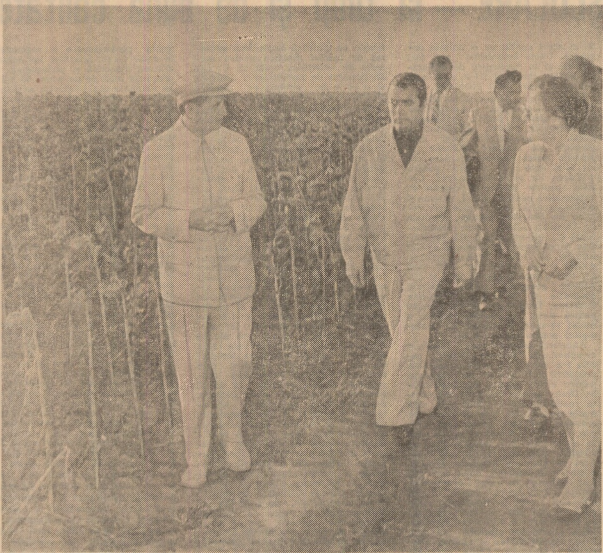
(Urmare din pag. 1)

de aici a permis încadrarea în perioada optimă de coacere. În legătură cu aceasta, tovarășul Nicolae Ceaușescu a atras atenția asupra necesității de a se asigura semințul mai timpuriu al porumbului.