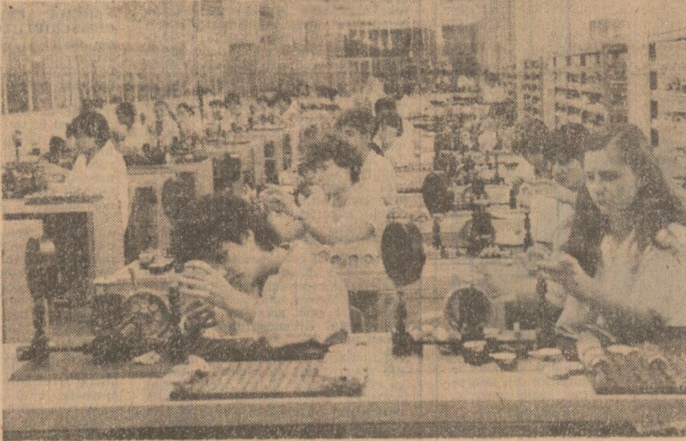
Colectivul întreprinderii mecanică fină din Capitală realizează o gamă largă de produse de tehnică de virf, care, datorită calității și fiabilității, sînt tot mai intens solicitate la export. Dama de elevat este faptul că în perioada care a trecut din acest an, colectivul de aici a depășit planul la export cu 12,5 la sută. În imagine: aspect de muncă din secția manometre, unde se lucrează la noi produse pentru export.

Colectivele muncitorești din județul Botoșani împlinesc Conferința Națională a partidului cu noi și semnificative fapte de muncă în agricultura Botoșani au reușit să producă numai în decurs de o săptămîină primele matrițe pentru injectat elemente componente ale unor utilaje agricole modernizate. La întreprinderea de articole tehnice din cauciuc Botoșani au fost asimilate noi modele de garnituri presate și profilate, ridicînd la peste 200 numărul noilor repere introduse în fabricație în acest an. (Eugen Ilrusec).