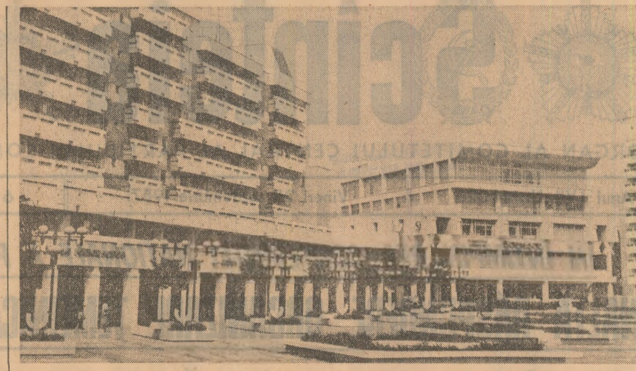
Din noua arhitectură a municipiului Satu Mare.