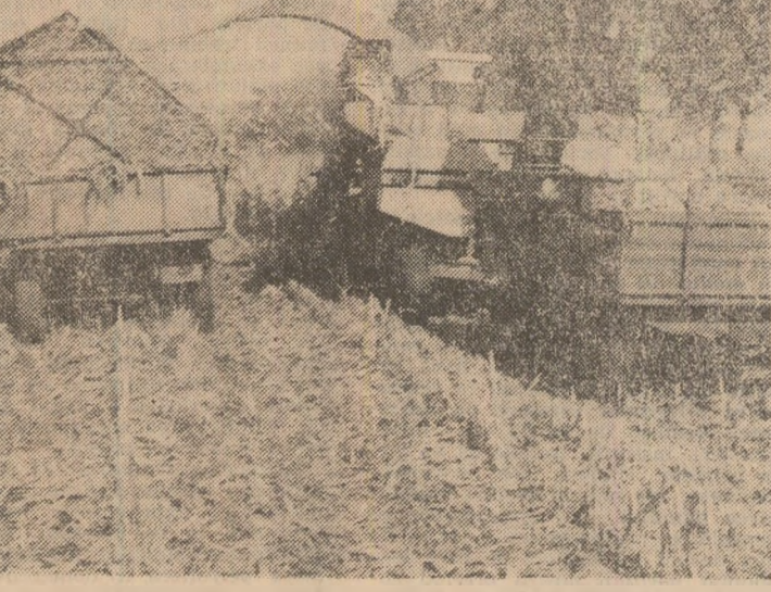
Recoltarea porumbului avansează rapid la C.A.P. Drăgoiești