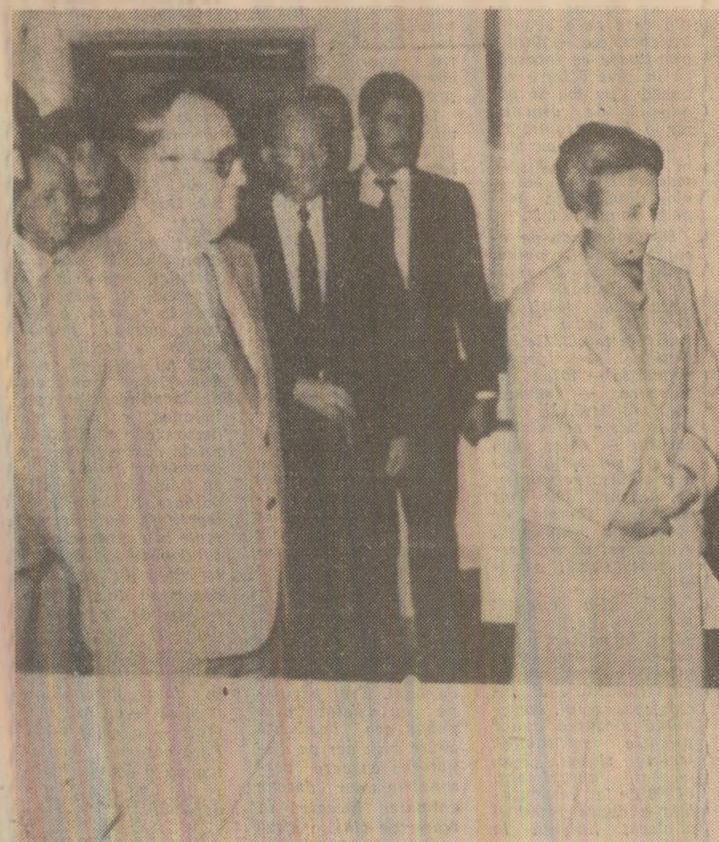
La Institutul de cercetări științifice în domeniul pomiculturii

In semn de profundă stimă, distinși oaspeți au fost primiți cu pline și sare, li s-au oferit buchete de flori.