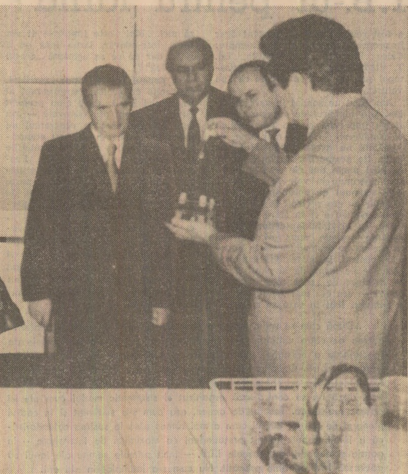
La Expoziția realizărilor construcției de mașini, electronicii și chimiei bulgare