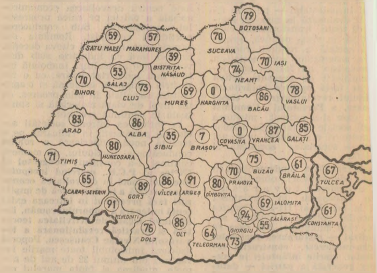
STADIUL RECOLTĂRII PORUMBULUI, în seara zilei de 7 octombrie procente, pe județe. (Date comunicate de Ministerul Agriculturii).