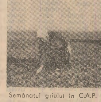
Semănatul grăuilor la C.A.P. Coșereni, județul Ialomița