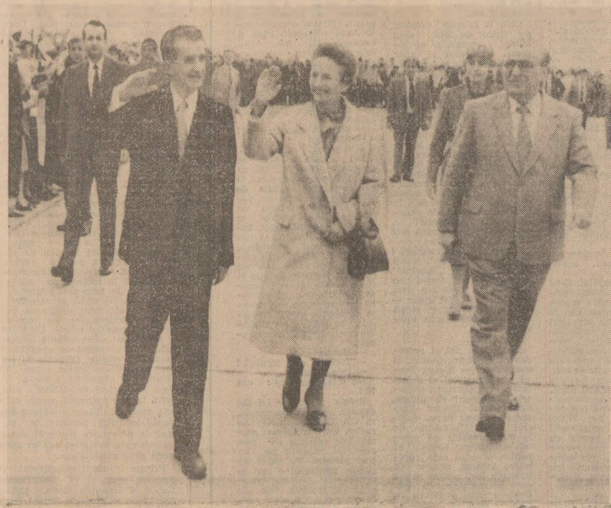
Oaspeții ai orașului Plovdiv

Convorbirile și dîneul s-au desfășurat sub semnul prieteniei ce caracterizează relațiile româno-bulgare.