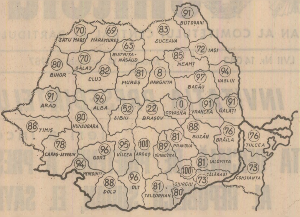
STADIUL RECOLTĂRII PORUMBULUI, în seara zilei de 12 octombrie, în procente, pe județe. (Date comunicate de Ministerul Agriculturii).

Pînă în seara zilei de 12 octombrie, PORUMBUL A FOST CULES DE PE 81 LA SUTĂ DIN SUPRAFEȚELE CULTIVATE. PRODUCȚIA A MAI RĂMAS DE ADUNAT DE PE 376.600 HECTARE. Timpul este acum foarte înalt, locurile de cules sînt scumpe și trebuie să se asigure forțele și mijloacele necesare pentru a se asigura transportul, livrarea și depozitarea porumbului în cele mai bune condiții. Este o cerință majoră, ce se impune cu atît mai mult cu cît pe cimp se află încă mari cantități de porumb, iar vremea se poate înrăutăți, de la o zi la alta. Pentru evitarea cu desăvîrșire a pierderilor de recoltă este deci imperios necesar ca în același timp cu recoltarea să se încheie și transportul și depozitarea producției.