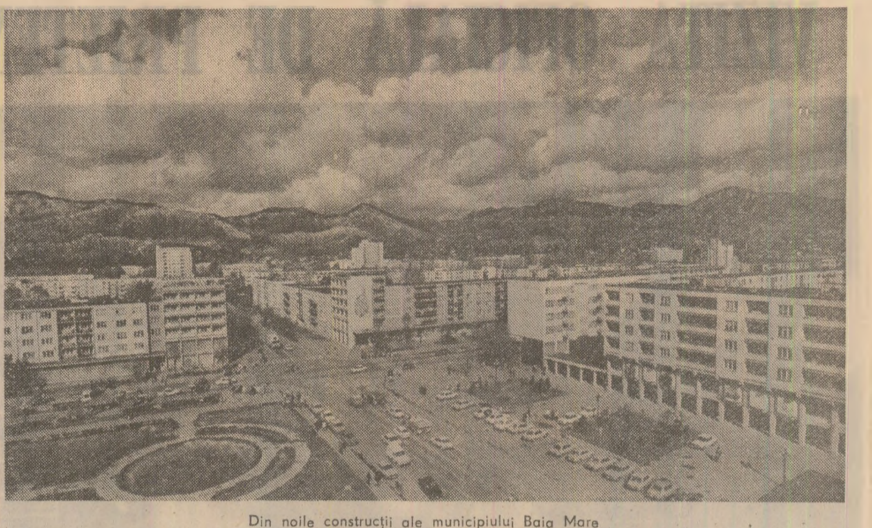
Din noile construcții ale municipiului Baia Marea