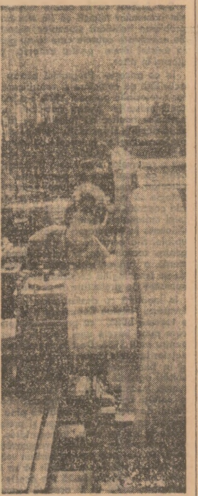
Negrești-Oas. Aspect dintr-una din secțiile întreprinderii de utilaj minier și tehnologic.

— N-am emis niciodată pretenția că echipamentele noastre de serie corespund mediului industrial. Dar nici n-am spus că nu sîntem capabili să le facem să corespundă. Pentru aceasta este însă nevoie de o eferă fermă, de un contract de cercetare-proiectare, de un anumit număr de produse. Or Ministerul Industriei Metalurgice nu ne-a solicitat niciodată în acest sens. Spre deosebire de alți colaboratori, din domeniul naval sau nuclear, pentru care am reușit să onorăm cereri dintre cele mai dificile.