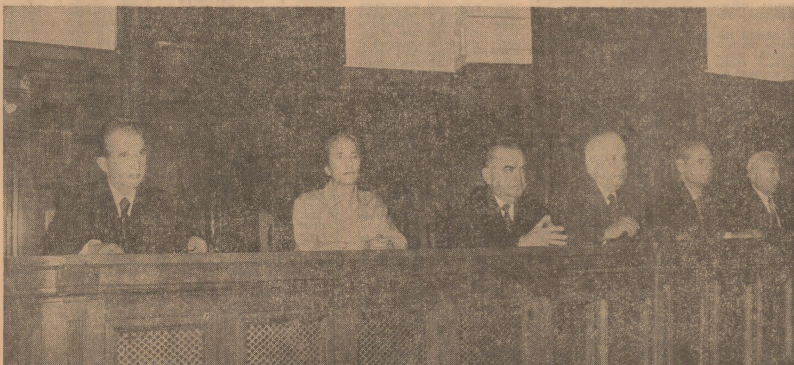
În prezența tovarășului Nicolae Ceaușescu, secretar general al Partidului Comunist Român, președintele Republicii Socialiste România, vineri, 30 octombrie, au avut loc lucrările sesiunii a VI-a a celei de-a IX-a legislaturi a Marii Adunări Naționale.

Lucrările actualei sesiuni se desfășoară în atmosfera de puternică angajare patriotică în care întregul nostru popor acționează pentru îndeplinirea în cele mai bune condiții a planului pe acest an, pentru a împlini cu noi și tot mai importante succese Conferința Națională a partidului și împlinirea a patru decenii de la proclamarea Republicii.