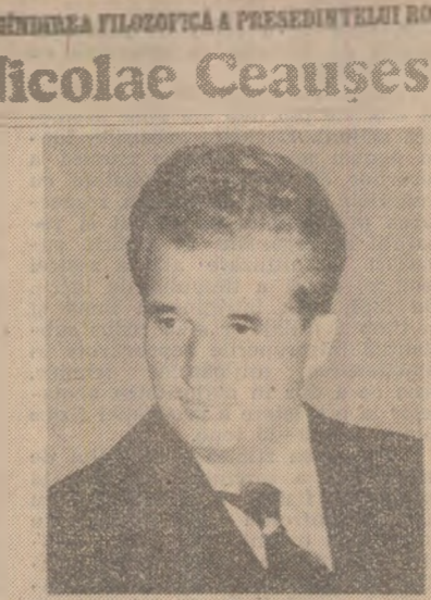
Dialectica dezvoltării societății românești contemporane EDITURA POLITICĂ

Inaugurată de Congresul al IX-lea, o strategie de dezvoltare economico-socială pe termen lung, călăuzită de imperativul realizării integrale a trăsăturilor proprii socialismului. Potrivit acestui vizion, pentru a se ajunge la faza superioară a noi orizonturi — comunismul — sînt necesare multiple și profunde transformări în toate sferile vieții economico-sociale, în lumina unei concepții largi, cuprinzătoare asupra sarcinilor construcției socialiste, străină oricărei tendințe spre unilateralizare și reducționism. Continutul acestui proces îl constituie tocmai făcerea societă-