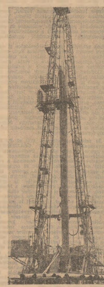
Aspect de la șchea de producție petrolieră Șchea.

Petre CRISTEA Ion STANCIU Gheorghe MANEA