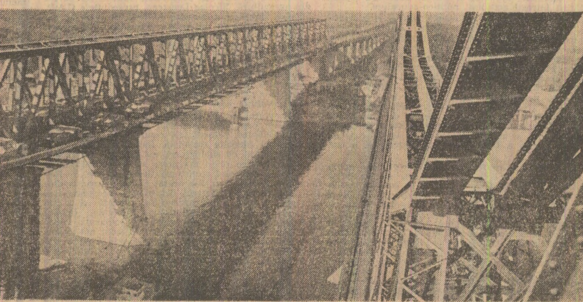
Referindu-ne numai la podul de la Cernavodă — pentru care ne aflăm acolo — am reținut că execuția sa a fost asigurată în totalitate în țară. Este cel mai mare pod peste Dunăre — cu cale ferată dublă și autostradă la același nivel — având o lungime de 470 m și o deschidere centrală de 190 m. Numai tablajul podului cintărește cam 9.900 tone, iar viaductul — încă 9.850 tone. Execuția podului a înesut din ambele capete, iar joncțiunea, cu exactitate de milimetru, s-a făcut în primăvara acestui an.

Pește Dunăre plutește încă eșarfa de abur a dimineții. Trenul care ne aduce de la București salută podul construit de Anghel Saligău la Cernavodă, salută Dunărea, salută noul pod dunărean spre care dorobanzii increment în bronz privește vizionar de aproape un secol. Acum are ce vedea! Și noi avem; asistăm la un fel de asediu. Dintr-un capăt și din celălalt al podului nou, șiruri compacte de locomotive și de autobuscule stau gata de start, tăcute și maiestuoase. Așteaptă și ele evenimentul care și pe noi, cei ce peste un minut vom coborî din tren, ne-a dus aici: probele ce preced apropiata punere în funcțiune a podului.