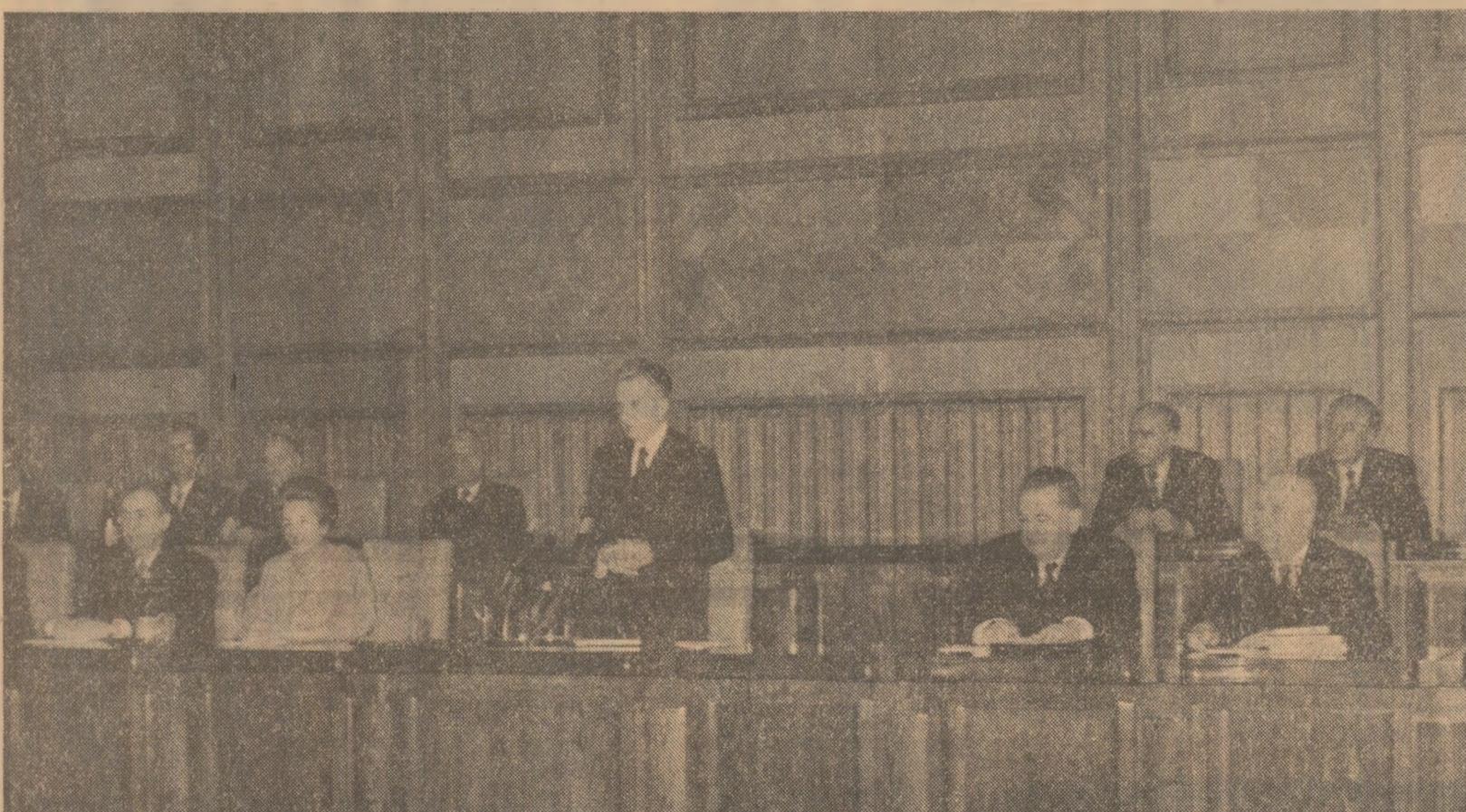
Sub președinția tovarășului Nicolae Ceaușescu, secretar general al Partidului Comunist Român, a avut loc, duminică, 13 decembrie, plenara Comitetului Central al Partidului Comunist Român.

Plenara a aprobat, în unanimitate, documentele ce vor fi prezentate spre dezbateri Conferinței Naționale a Partidului Comunist Român din 14-16 decembrie 1987: