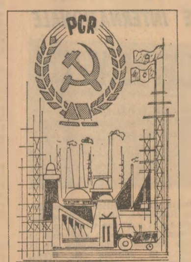
CONFERINȚA NAȚIONALĂ A PARTIDULUI

Casele de cultură, cluburile muncitorești, căminele culturale, mu-