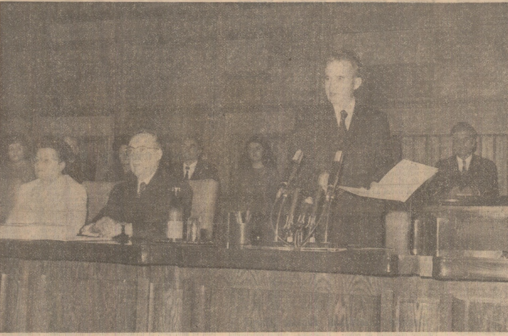
Sub președinția tovarășului Nicolae Ceaușescu, secretar general al Partidului Comunist Român, președintele Republicii Socialiste România, plenara Consiliului Național al Frontului Democrației și Unității Socialiste.