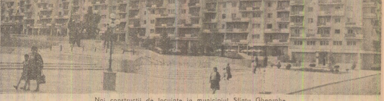
Noi construcții de locuințe, în municipiul Sîntu Gheorgha

COMITETUL CENTRAL AL ORGANIZAȚIEI DEMOCRAȚIEI ȘI UNITĂȚII SOCIALISTE