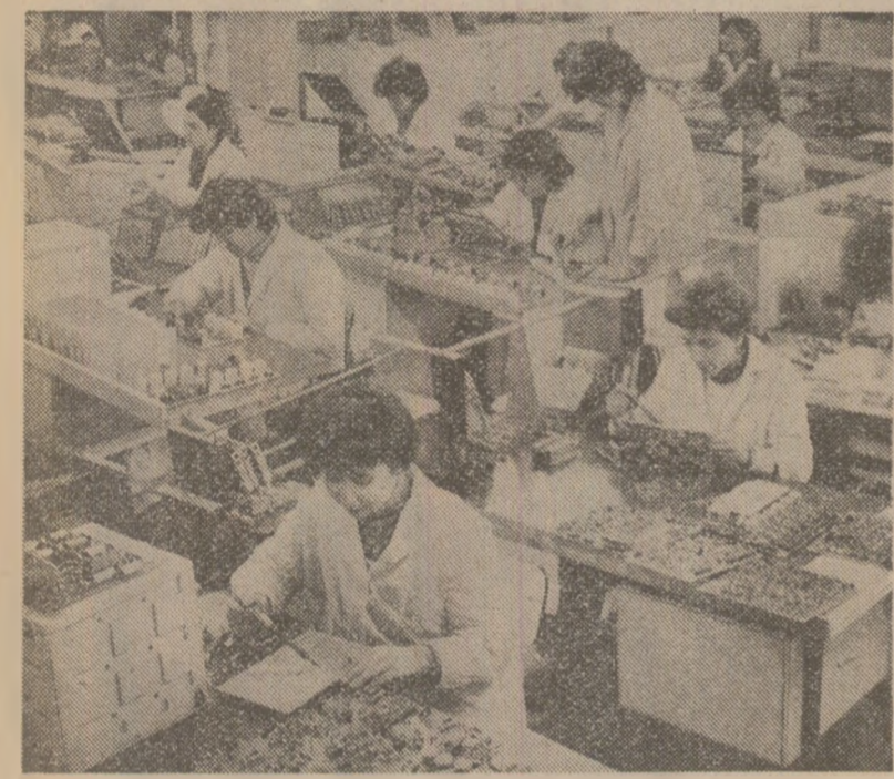
În secția montaj circuite electronice industriale a întreprinderii „Electrotehnică” din Capitală.