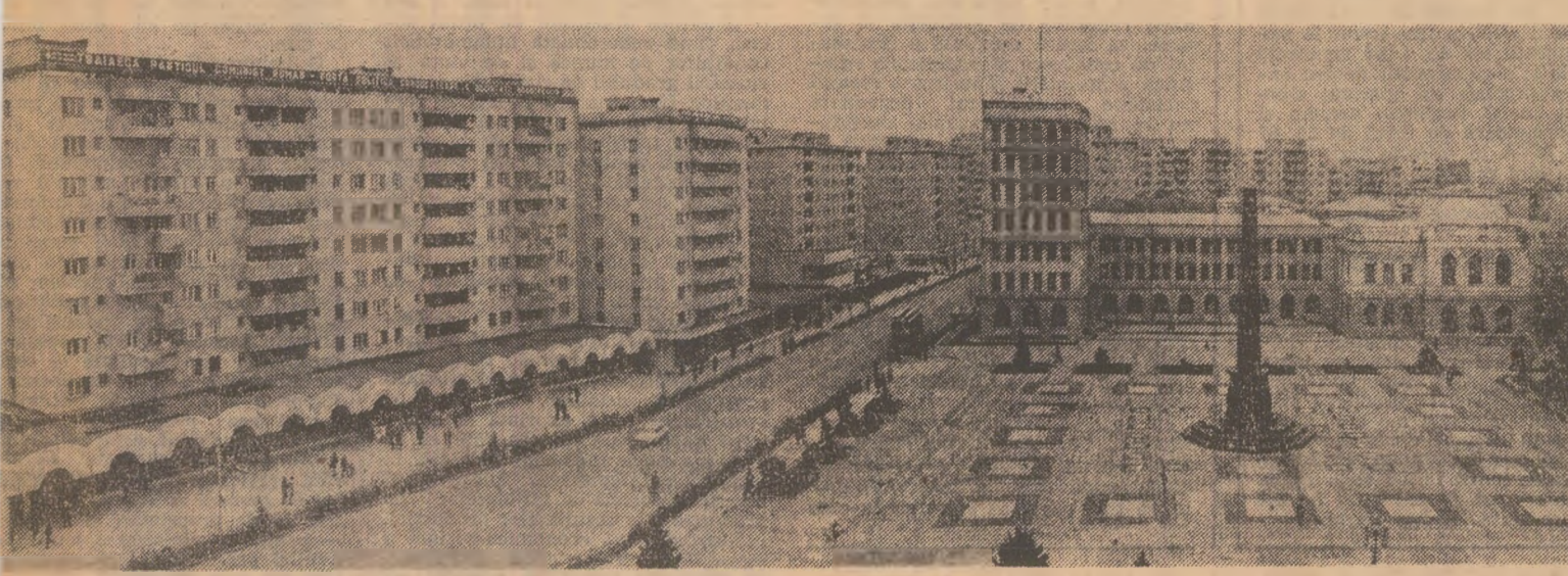
Focșani — argument al arhitecturii moderne