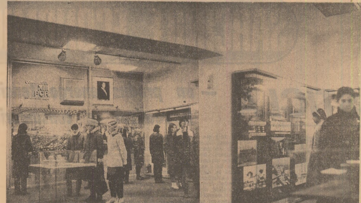
Aspect de la Muzeul Unirii din Alba Iulia

Strucțiunea posibilităților create de proprietatea socialistă și de autoconducere implică, totodată, îmbunătățirea permanentă a formelor de organizare a producției și a muncii în