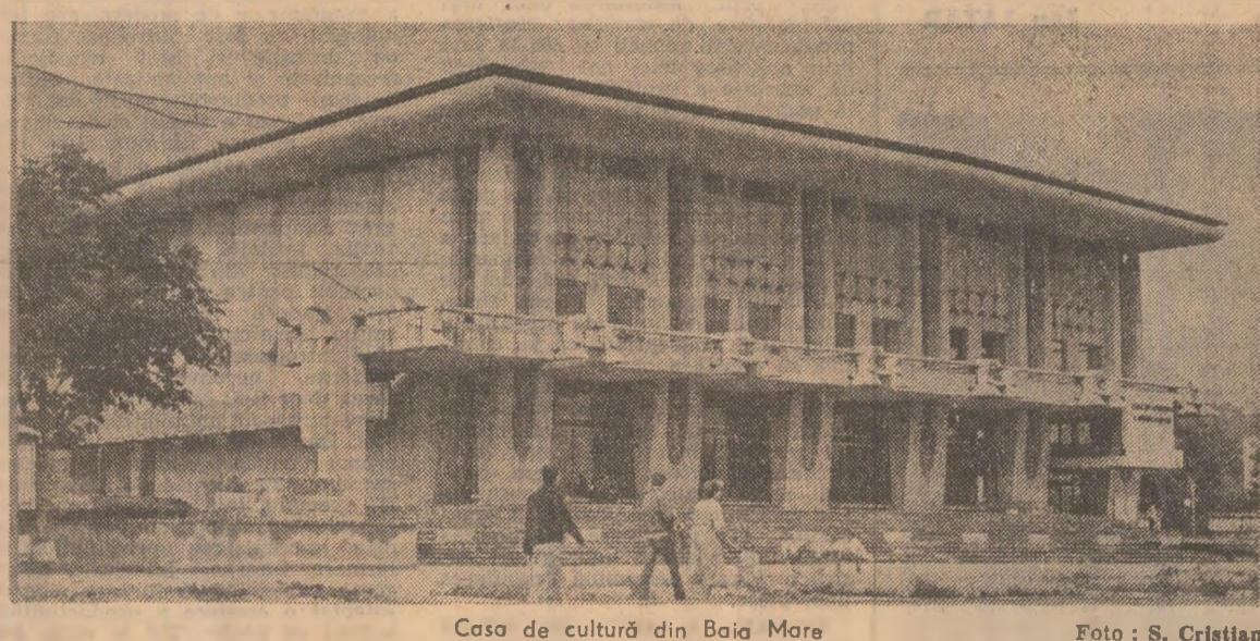
Casa de cultură din Baia Mare