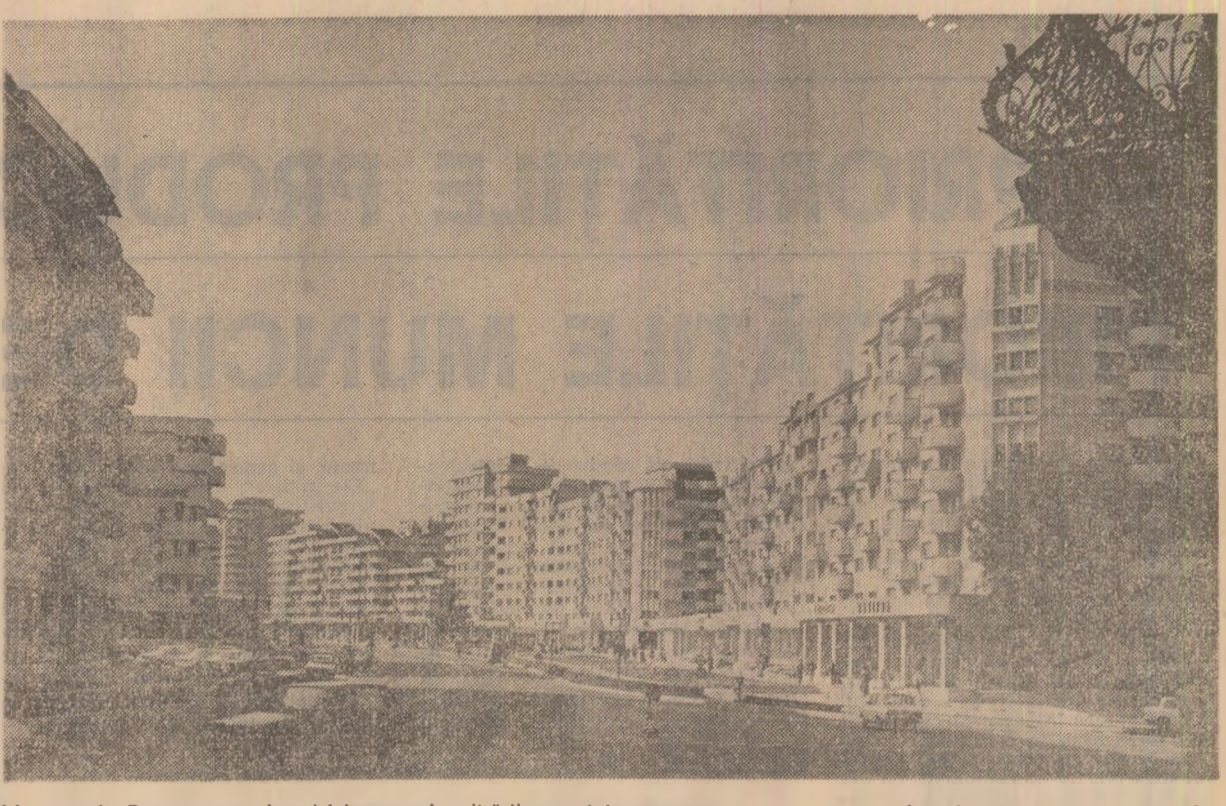
Municipiul Pitești, ca de cîntec toate localitățile patriei, a cunoscut o puternică dezvoltare economică-socială. În fotografie: cîteva din noile construcții de locuințe