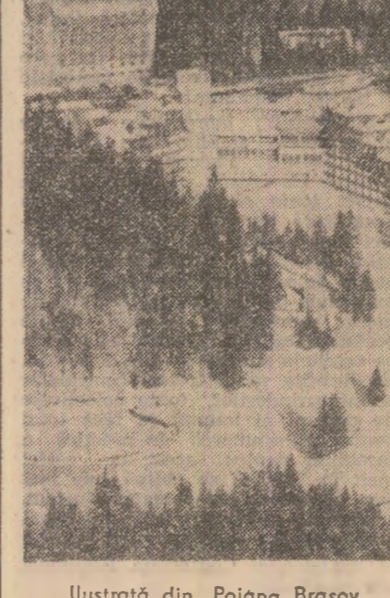
Ilustrată din Poiana Brașov

Chiar și formalismul. S-a schimbat ceva în urma acestor adunări? Am întrebat. — Nu, nimic. S-au expus, unii s-au arănat că vor face totul pentru îndeplinirea lor și cam atât. Tovarășii din centrală nici n-au vrut să audă că, de exemplu, voram discuta condițiile necesare pentru a produce 200.000 mp parbrize duplex. „Discutam degeaba, mi s-a răspuns și săracii.” — I-ați pus vreodată în discuție, în adunarea generală a reprezentanților, pe cei care s-au arănat să facă și să creadă, dar care pînă la urmă n-au făcut nimic? — Nu, n-am făcut-o, desigur, acum nu dăm seama de asta. Pentru că