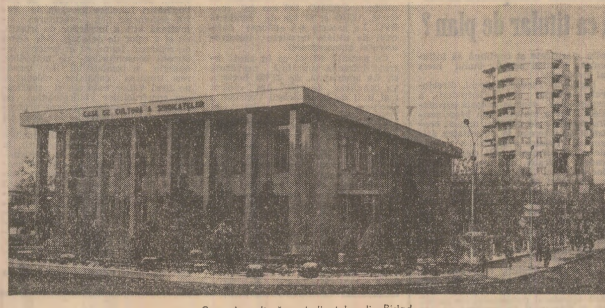
Casa de cultură a sindicatelor din Birlad