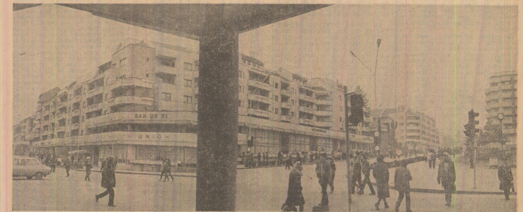
Imagine din centrul orașului Rimnicu Vilcea