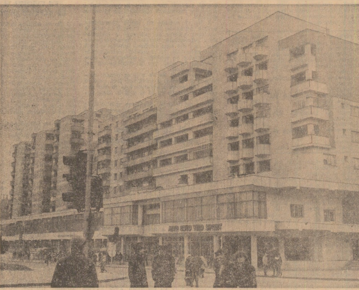
Locuințe noi, moderne în municipiul Rimnicu Vilcea.