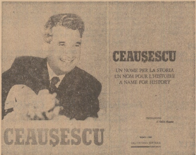
Capitolul intitulat „Ceaușescu — un neobosit luptător pe frontul păcii” — în context, ca în ultimele peste două decenii, de la București au pornit numeroase inițiative privind aspectele fundamentale ale dezarmării, ale garanțiilor păcii pe planeta noastră, soluționării problemelor spinosă ale contemporaneității și edificării unei lumi mai bune și mai drepte.

Festivitatea lansării albumului omagial „Ceaușescu — Un nume pentru istorie” a avut loc la Palatul Boromini din Roma și a reunit reprezentanți ai vieții politice, economice și culturale italiene, zărilor, în cuvântul său, deputatul UGO GRIPPO a arătat: Președintele României, Nicolae Ceaușescu, este, în opinia sa, unul dintre protagoniștii care au militat cu consecvență pentru afirmarea și concre-