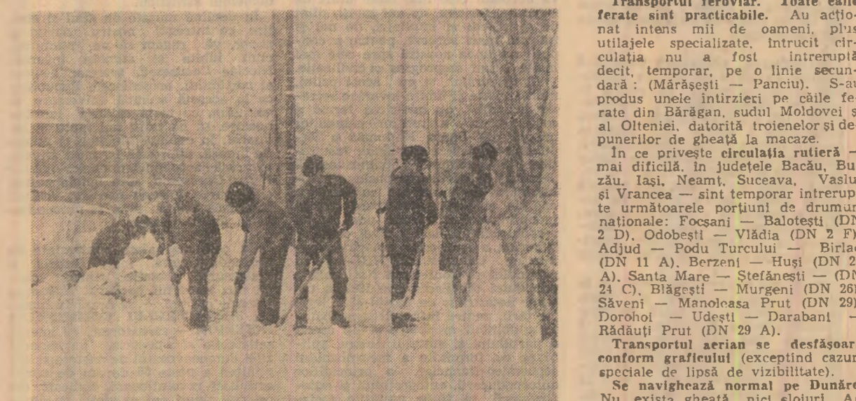
În Capitală, oamenii muncii au acționat cu operativitate pentru degajarea arterelor de circulație de zăpadă...