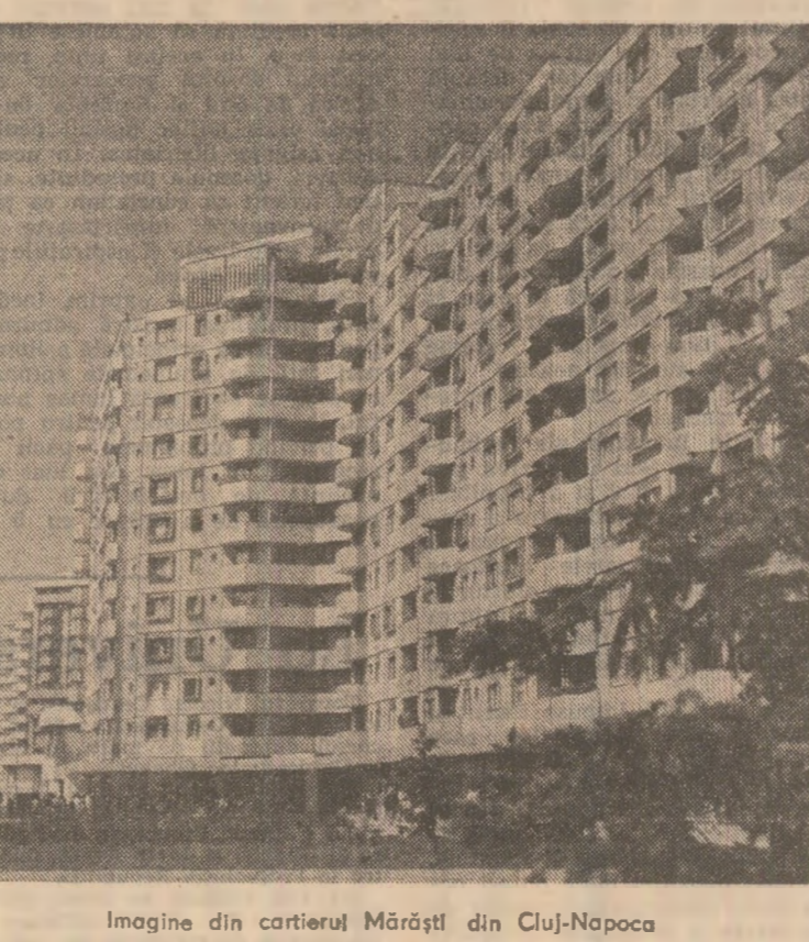
Imagine din cartierul Mărăștii din Cluj-Napoca