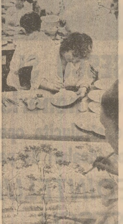
Aspect din secția pictură manuală a întreprinderii de țesături și sticlărie „Faimor” din Bala Mare