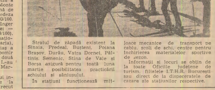
Stratul de zăpadă existent la Sinaia. Predeal, Busteni, Poiana Brasov, Durau, Vatra Dornei, Paltin, Semeic, Stina de Vale și Borsă asigură pentru toată luna martie posibilitatea practicării schiului și săniușului. În stațiuni funcționează mi-

Șchi. În prima zi a turneului internațional feminin de volei de la Havana, selecționata Cunei a întrecut