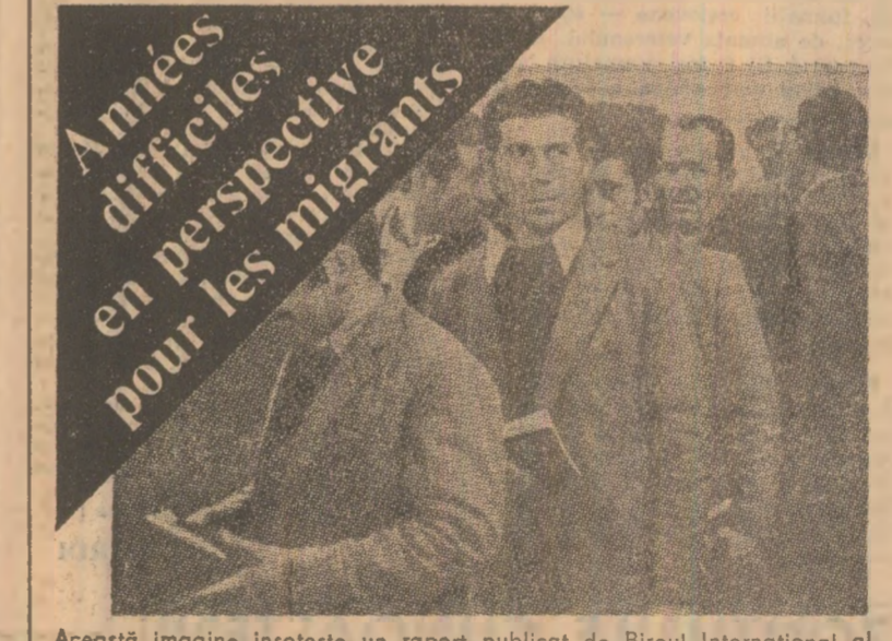
Această imagine însoțește un raport publicat de Biroul Internațional al Muncii, privind situația imigranților din țările occidentale