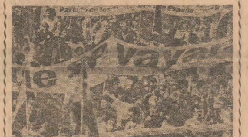
Demonstrație antimilitaristă în orașul spaniol Torrejon