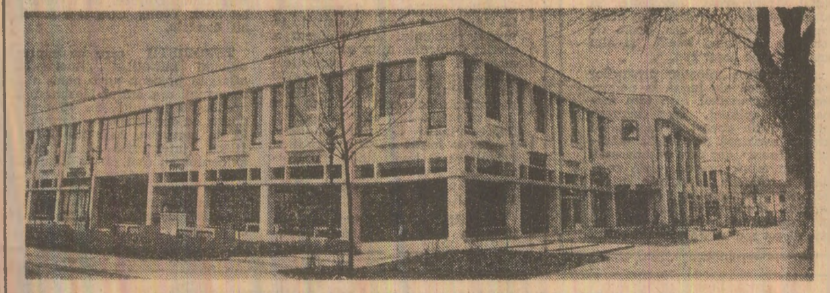
Magazinul tehnologic, saloanele de restaurant (unul cu autoservire), magazinul alimentar, anexele pentru palserie, cofetărie...