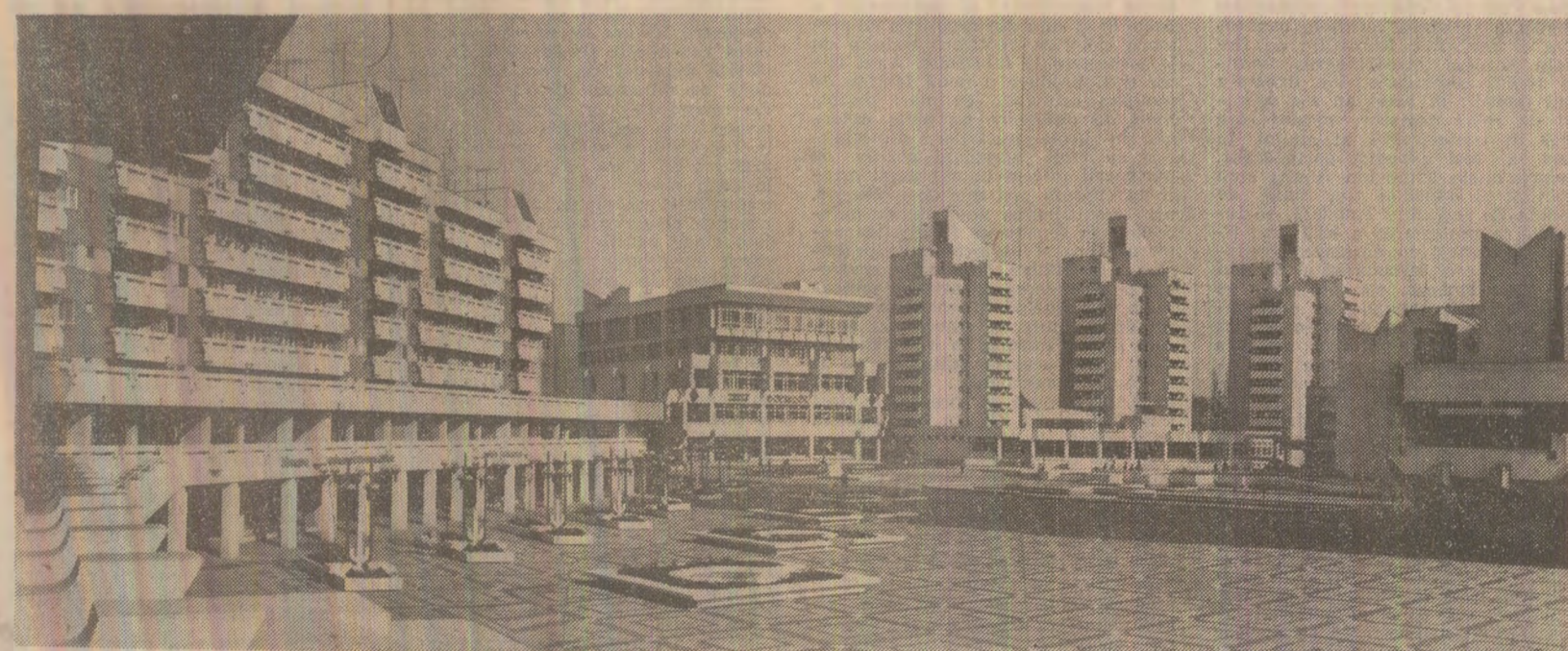
Din noua arhitectură a municipiului Satu Mare