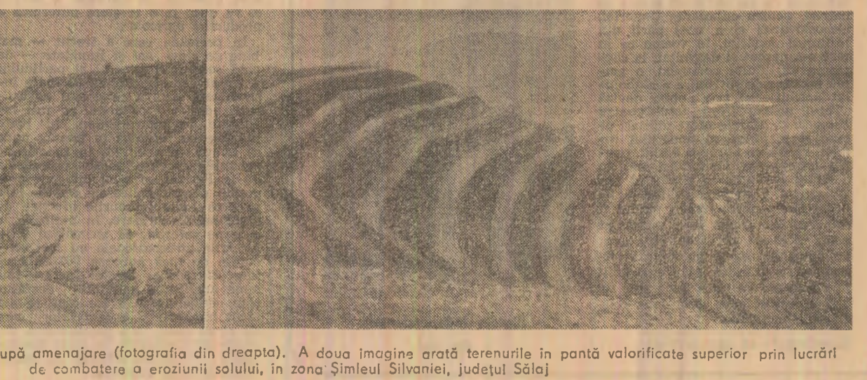
Înainte (fotografia din stînga) și după amenajare (fotografia din dreapta). A doua imagine arată terenurile în pantă valorificate superior prin lucrări de combatere a eroziunii solului, în zona Șimleu Silvaniei, județul Sălaj

deosebite este de remarcă ritmul din executie a lucrărilor de combatere a eroziunii solului înregistrat în ultimii ani, superior multor județe din zonă unde realizările sînt cu mult prea mici comparativ cu suprafețele afectate de eroziune. În 1987 au fost amenajate 12.000 hectare, iar pînă în 1990 se prevede executarea unor astfel de lucrări pe încă 30.000 hectare, ceea ce va permite ca județul Sălaj să încheie printre primele amenajarea antierozională a întregii suprafețe prevăzute. Toate acestea evideriază o experiență valoroasă. Faptul că, acolo unde există totuși unele probleme, se manifestă unicele de acțiune și gândire — de la comitetul județean de partid, organele de execuție și de exploatare și pînă la unitățile agricole beneficiare — constituie un exemplu de generalizare metodelor și tehnologiilor de lucru științifice pe terenurile în pantă pot fi îndeplinite în mod exemplar. Chiar și succint, merită înfățișate soluțiile adoptate în Sălaj, acestea fiind, cum arătam, valabile pentru un areal mai întins în zona Transilvaniei. Problema principală o constituie aici eliminarea excesului de umiditate de pe versanții dealurilor din luncile, prin drenaj închis, în care scop au fost experimentate diferite tipuri de materiale filtrante,