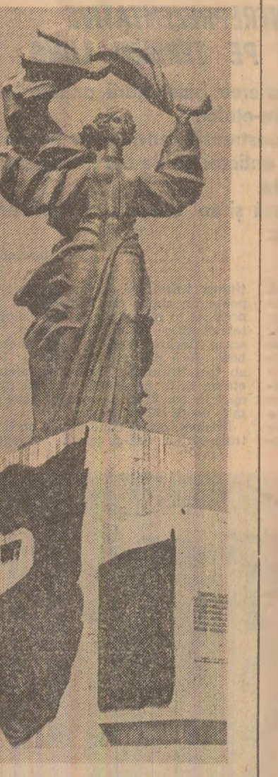
Statuia Independenței, din Iași