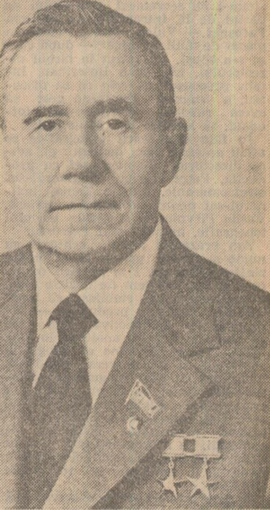
relațiile de prietenie care leagă poporul nostru. Spre aceasta este orientat și complexul de întelegeri de principiu realizate în timpul întâlnirii sovieto-române la nivel înalt, din mai 1967”.

relațiile de prietenie care leagă poporul nostru. Spre aceasta este orientat și complexul de întelegeri de principiu realizate în timpul întâlnirii sovieto-române la nivel înalt, din mai 1967”. Nutrim convingerea că vizita pe care tovarășul Andrei Andreevici Gromiko o întreprinde în țara noastră va reprezenta o nouă contribuție la dezvoltarea și amplificarea relațiilor de prietenie dintre România și Uniunea Sovietică, poporul român adreșează înaltului oaspete sovietic tradiționalul „Bun venit pe pămîntul României!”.