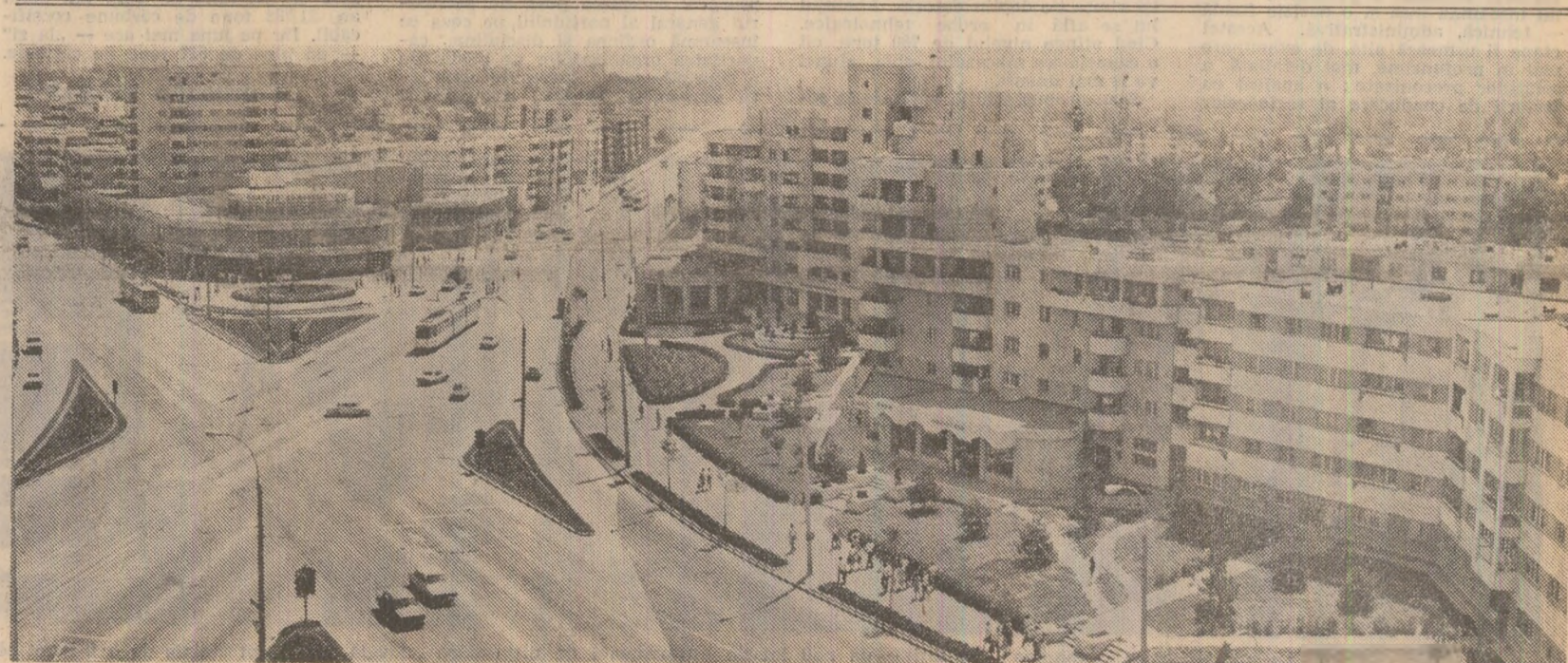
Vedere din cartierul Tomis, municipiul Constanța