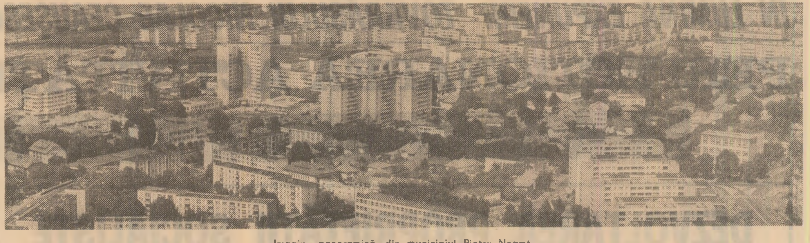
Imagine panoramică din municipiul Piatra Neamț