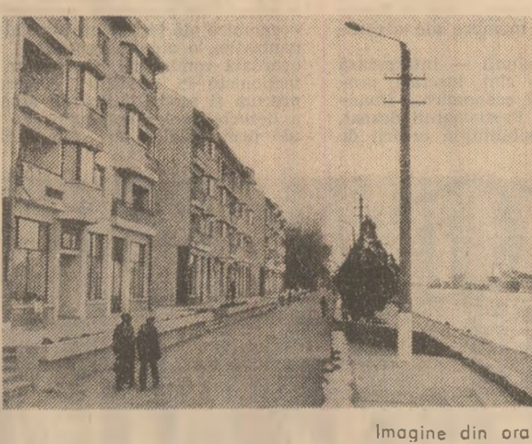
Imagine din orașul-port Sulina

falsă strălucire a fostului "Porto Franco". În secolul trecut, când s-au construit în toate stilurile, pe "Strada Intei" — cum este numită estacada care însoțește fluviul, precum și alte sute de clădiri de pe străzile celelalte, îndoindu-și pereții din pantanul sub acoperișul de sticlă.