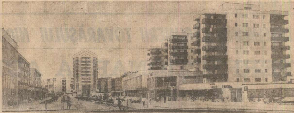
Imagine din cartierul „Zorilor”, din municipiul Cluj-Napoca