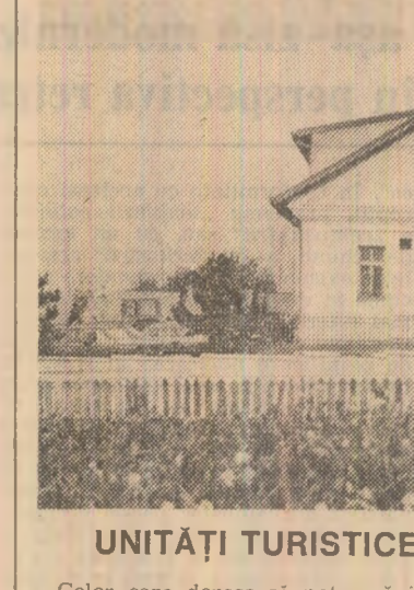
UNITĂȚI TURISTICE ÎN JUDEȚUL SUCEAVA

pregătirea elevilor din școlile profesionale trebuie să se desfășoare după o programă avînd în baza plan-ului de învățămînt. Dacă în programele pentru obiectele „Întreținerea și exploatarea tractoarelor” și „Mașini și instalații agricole”, editate de Ministerul Agriculturii și Ministerul Educației și Învățămîntului, se specifică faptul că sînt comune atît pentru licee agroindustriale, cit și pentru școli profesionale, pentru „Întreținerea practică”, disciplină de bază pentru care în școala profesio-nală s-au alocat 122 de ore (de două ori și jumătate mai mult decît reprezintă activitatea la clasă și în atelier I), direcția de resort din Mi-nisterul Agriculturii recomandă a-daptarea programelor claselor a XI-a și a XII-a ale liceelor agroindus-triale. Acestea însă au de efectuat numai 864 de ore. În fapt, după cum am arătat, se folosesc programe vechi care circula în copii de la o școală la alta. Nu sîntem în măsură să ne pronunțăm asupra programelor în cauză, care sînt bune și care nu. Un lucru este însă clar: această for-mă de pregătire, respectiv școala profesională, folosirea „adaptărilor”, așa cum vom vedea, lasă loc la dezordine, la diluarea răspunderilor pentru însuși pregătirea practică a copilor. Dar asupra modului con-ter în care se desfășoară aceste ore de curs, instruirea practică a viito-rilor mecanizatori și perfecționarea pregătirii profesionale a cadrelor care preda în aceste școli vom stă-rui într-un viitor număr al ziarului nostru.