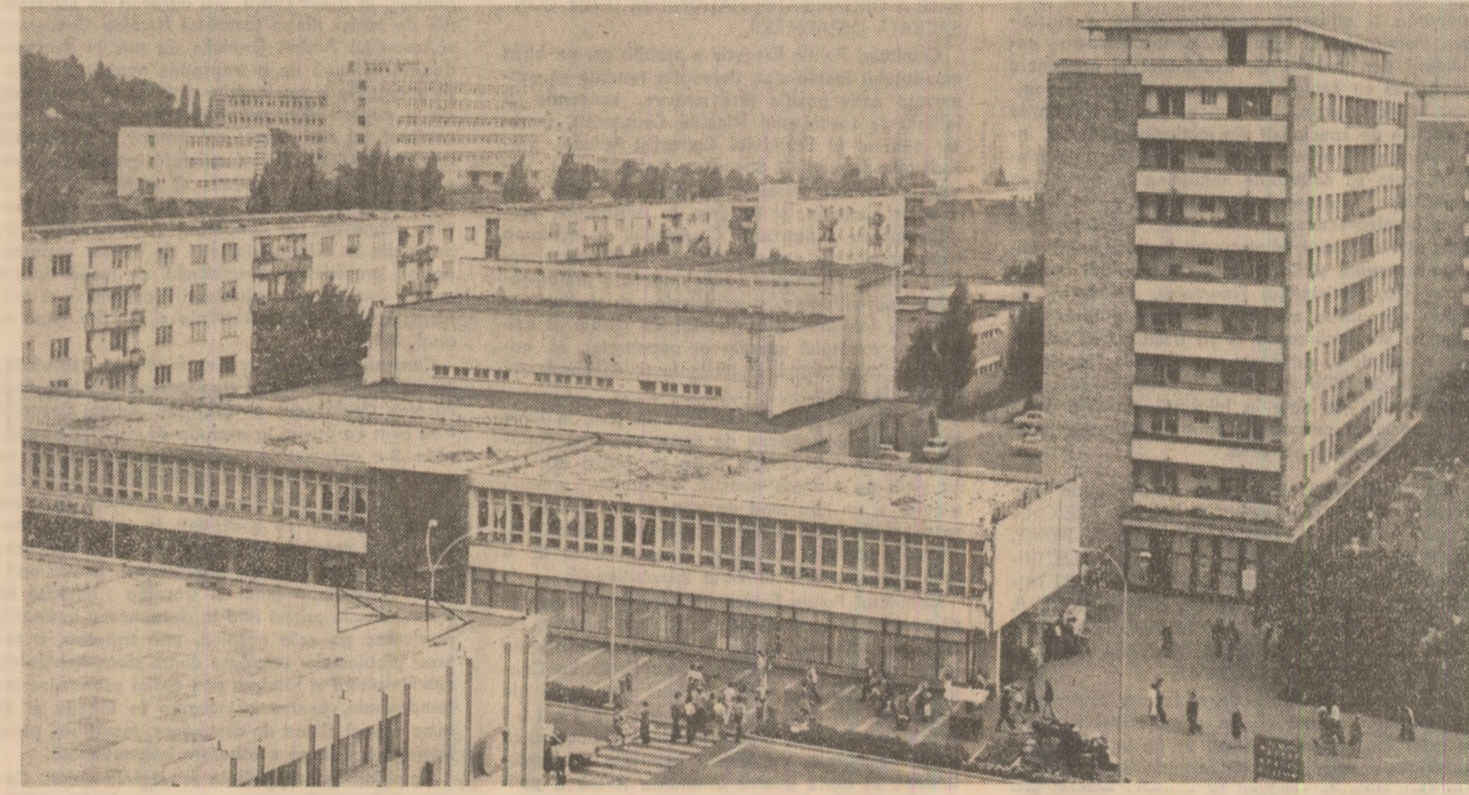
Imagine din municipiul Piatra Neamț

„La consecințele cu totul nedorite ale unei asemenea metodologii de centralizare excesivă...”