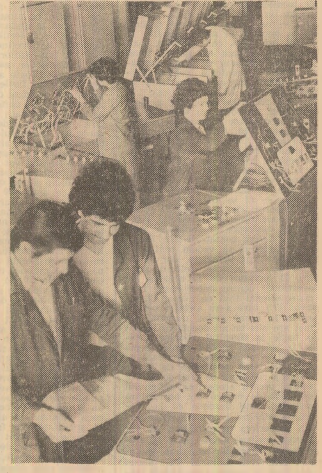
Produse noi, de înalt nivel calitativ