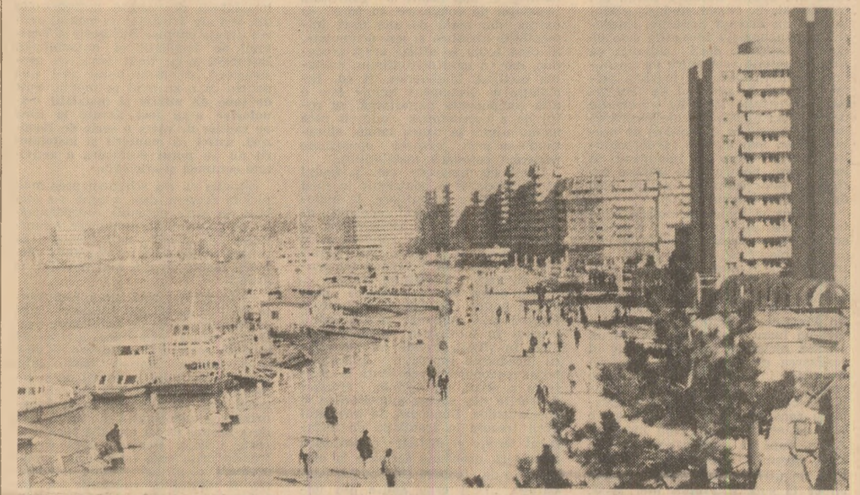
Tulcea — imagine de pe faleza