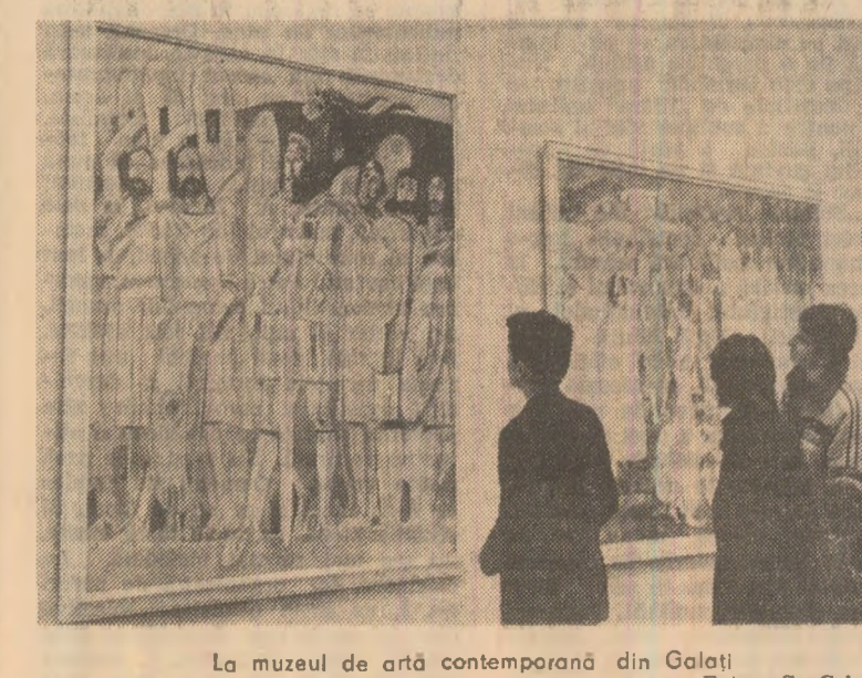
La muzeul de artă contemporană din Galați.