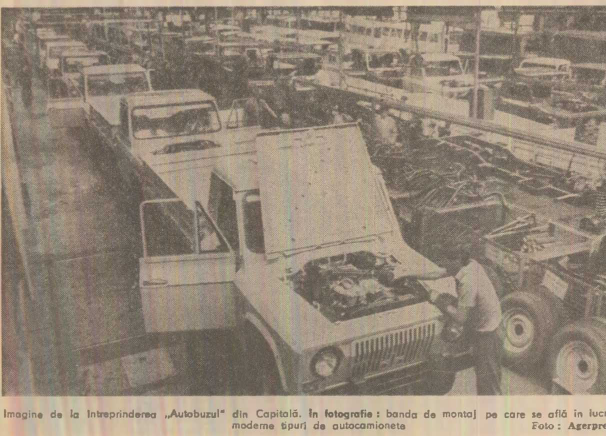
Imagine de la întreprinderea „Autobuzul” din Capitală. În fotografia: banda de montaj pe care se află în lucru moderne tipuri de autocamionete.

După cum se vede, deși orașele au un număr egal sau aproape egal de circumscripții, condiții geografice și economico-sociale apropiate, în Otlenița s-au formulat de peste două ori mai multe propuneri decît în Mizil, iar la Fetești aproape 6 ori mai multe propuneri decît la Mizil și aproape douăzeci de ori mai multe decît în Otlenița, cetățenii au avut de formulat, ca să spunem așa, cîte o... jumătate de propuneri! Aceste semne de redușă inițiativă gospodă-