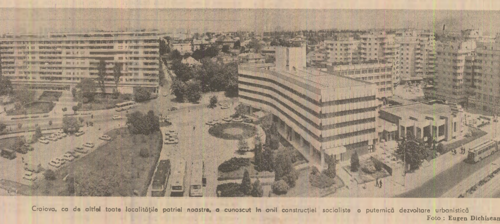
Craiova, ca de altfel toate localitățile patriei noastre, a cunoscut în onil construcției socialiste o puternică dezvoltare urbanistică