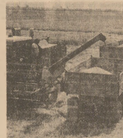
Recoltarea orzului la I.A.S. Deta, județul Timiș.