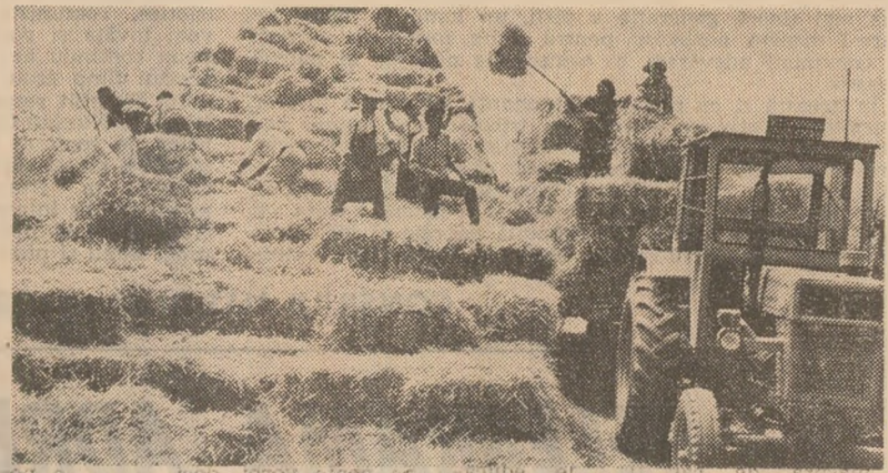
La C.A.P. Vieru, județul Giurgiu, poale de orz sînt strînse, trînspondu-se în depozite în baza furajelor