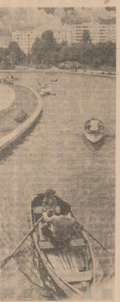
În parcul din Drumul Taberei din Capitală.