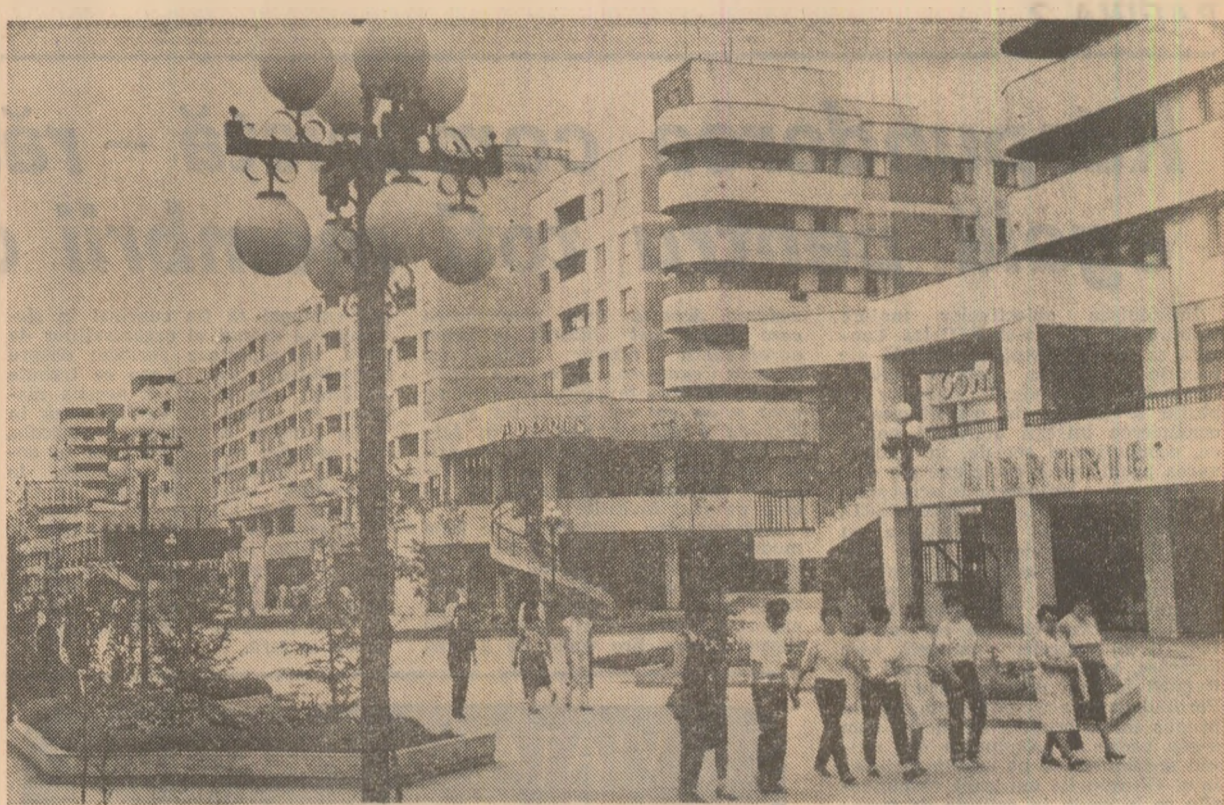
Din noua arhitectură a municipiului Alexandria

În concordanță cu asemenea exigențe, în România socialistă a fost creat și continuu perfecționat, din inițiativa secretarului general al