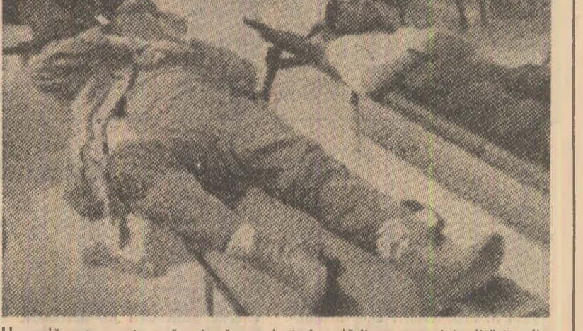
Un adăpost pentru săraci, improvizat în clădirea municipalității din Washington

poate găsi o slujbă sînt foarte rare. De pildă, cam 75 la sută din alcoolici trec printr-o cură de dezintoxicare care durează cîteva zile și apoi părăsesc centrul respectiv fără ca nimeni să se mai îngereze de ei. Același lucru se întîmplă și cu persoanele care suferă de tulburări psihice: ele intră pe usa turnantă a unor instituții sanitare și nu ceapă să fie rapădite de pe aceeași ușă. De fapt, în marile orașuri există posibilitățile de îngrijire a celor care suferă de boli mintale sînt acoperite doar în proporție de cinci până la zece la sută. Mai există și un aspect: „Poți să ieși aplicînd acestor oameni orice fel de tratament, declară Irving Shandler, directorul unui centru de reabilitare socială din Philadelphia. Dar dacă la sfîrșitul zilei îi trimiți înapoi într-un azil de noapte, alcoolul circula liber, n-ai făcut nimic”.