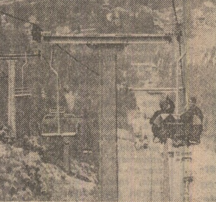
Invitație la Predeal

Locul I: Uniunea județeană Constanța. Locul II: Uniunea județeană Satu Mare. Locul III: Uniunea județeană Sălaj.