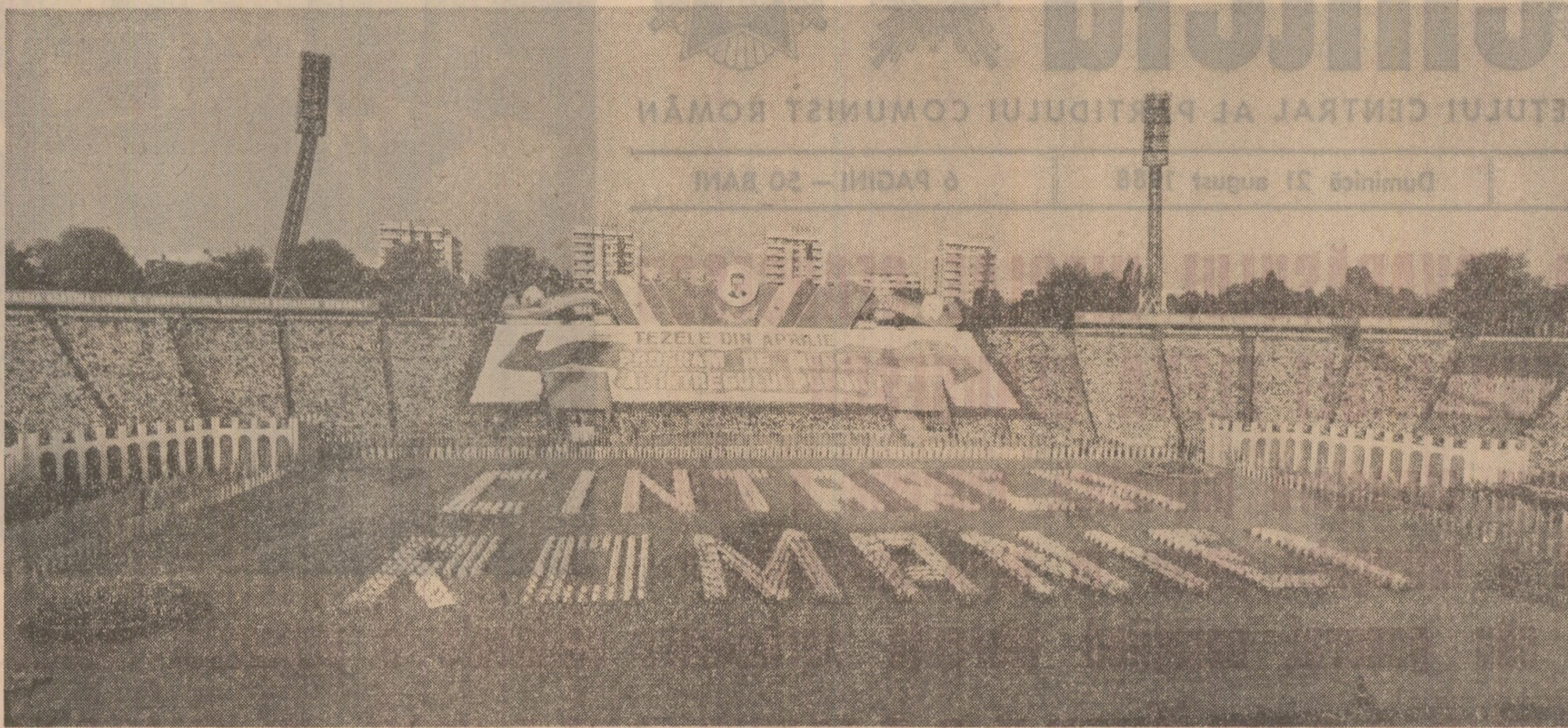
rea noastră adunare, consacrată sărbătorii Zilei naționale a poporului român, tovarășei Elena Ceaușescu, membru al Comitetului Politic Executiv al Comitetului

Permițiet-mă să adresez, cu aleasă stimă și deosebit respect, rugămintea de a lua cuvîntul la ma-