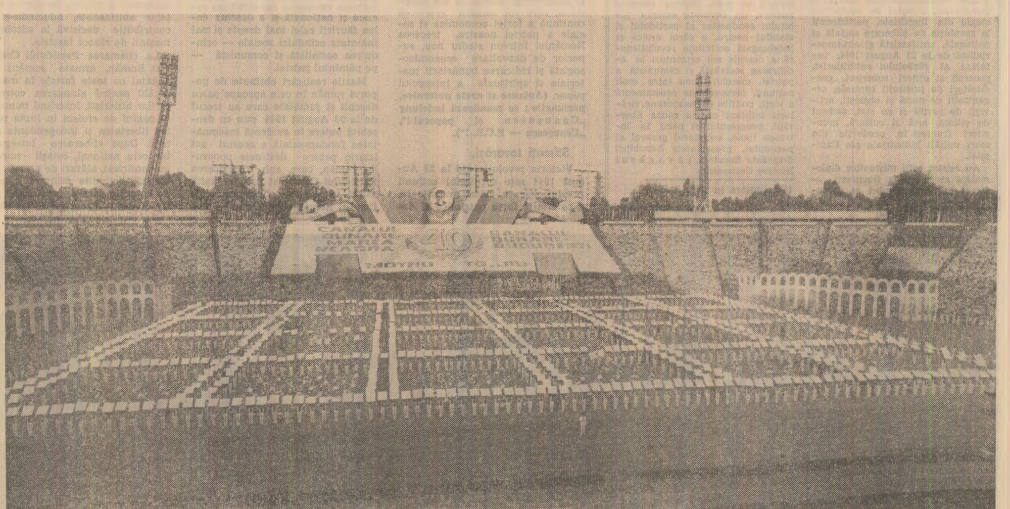
În lumina faptelor este fapta România să privească demnă cître omenire.

Sint prezentate imagini redînd aspecte din viața și activitatea tovarășei Elena Ceaușescu, puse în slujba fericirii poporului, înfiorării continue a patriei. Prind contur drapelul patriei și