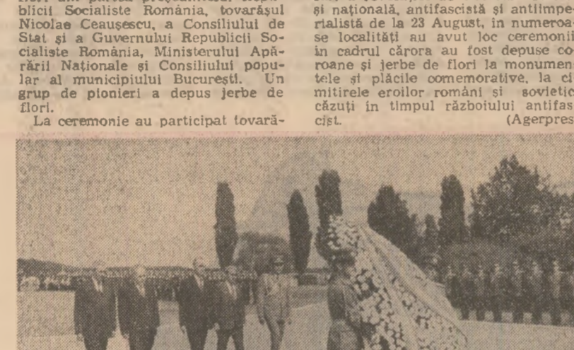
La Cimitirul militarilor britanici