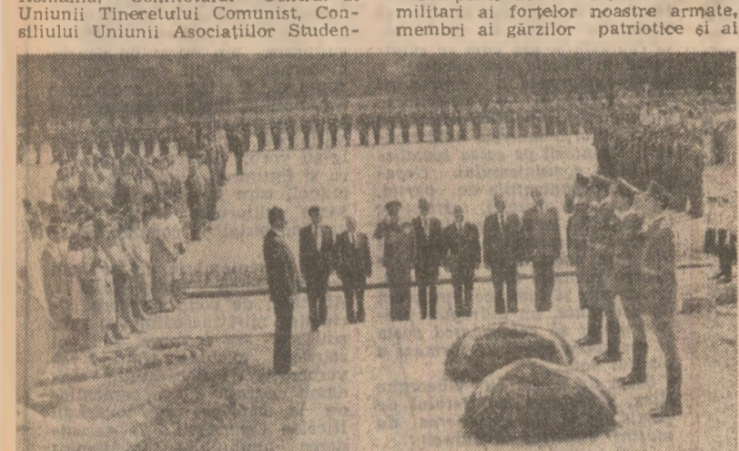
La Monumentul eroilor sovietici

formatiunilor de pregătire a tineretului pentru apărarea patriei, aliniate pe platourile din fața monumentelor, au prezentat onorul.