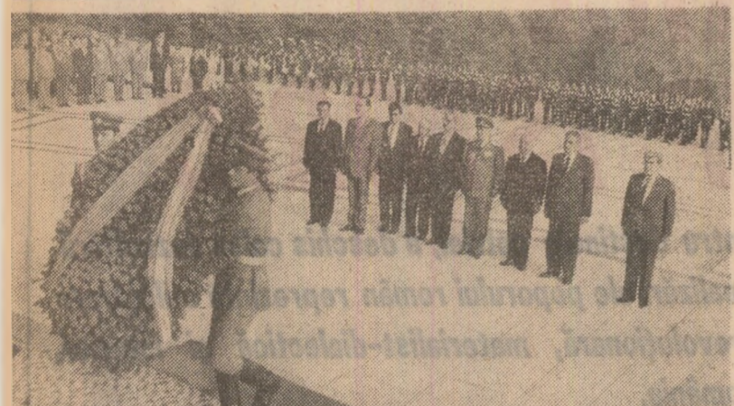
La Monumentul eroilor luptei pentru libertatea poporului și a patriei...