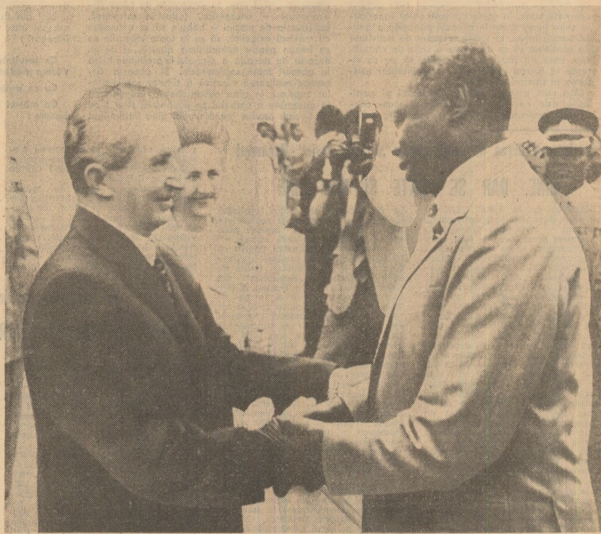
Miercuri, 7 septembrie, s-a încheiat vizita oficială de prietenie pe care președintele Republicii Socialiste România, tovarășul Nicolae Ceaușescu, împreună cu tovarășa Elena Ceaușescu, a efectuat-o în Republica Kenya, la invitația președintelui acestei țări, Daniel Toroitich arap Moi.