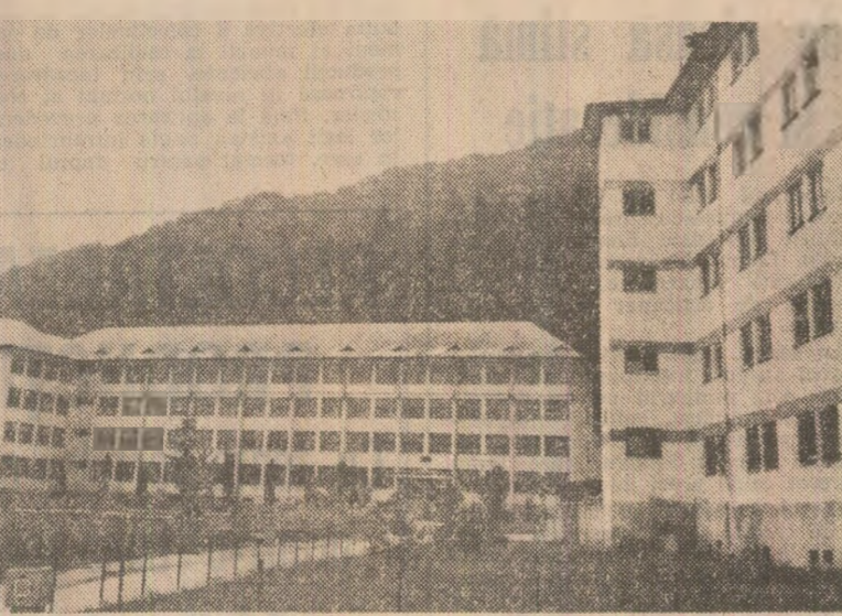
Frumosul și modernul se împletește armonios și în noul chip al așezărilor rurale vilceane. În imagine — clădirea nouă pentru școlii din comuna Costești — Vilcea, unde se pregătesc specialiștii viitorului centru agroindustrial

vală 17 meserii — avind numeroase și moderne săli de clasă.