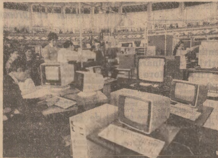
OPINII ALE UNOR OASPEȚI DE PESTE HOTARE