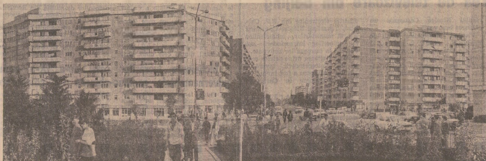
Focșani — localitatea de reședință a județului Vrancea — cunoaște astăzi o inflorire fără precedent în îndelungata sa istorie...