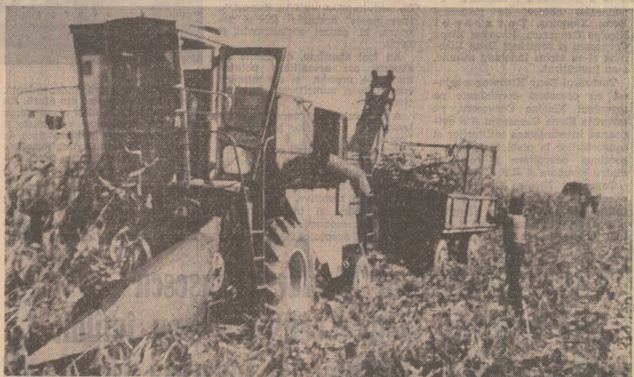
Recoltarea porumbului la cooperativa agricolă Turulung, județul Satu Mare

La Combinatul de articole tehnice din cauciuc Pitești