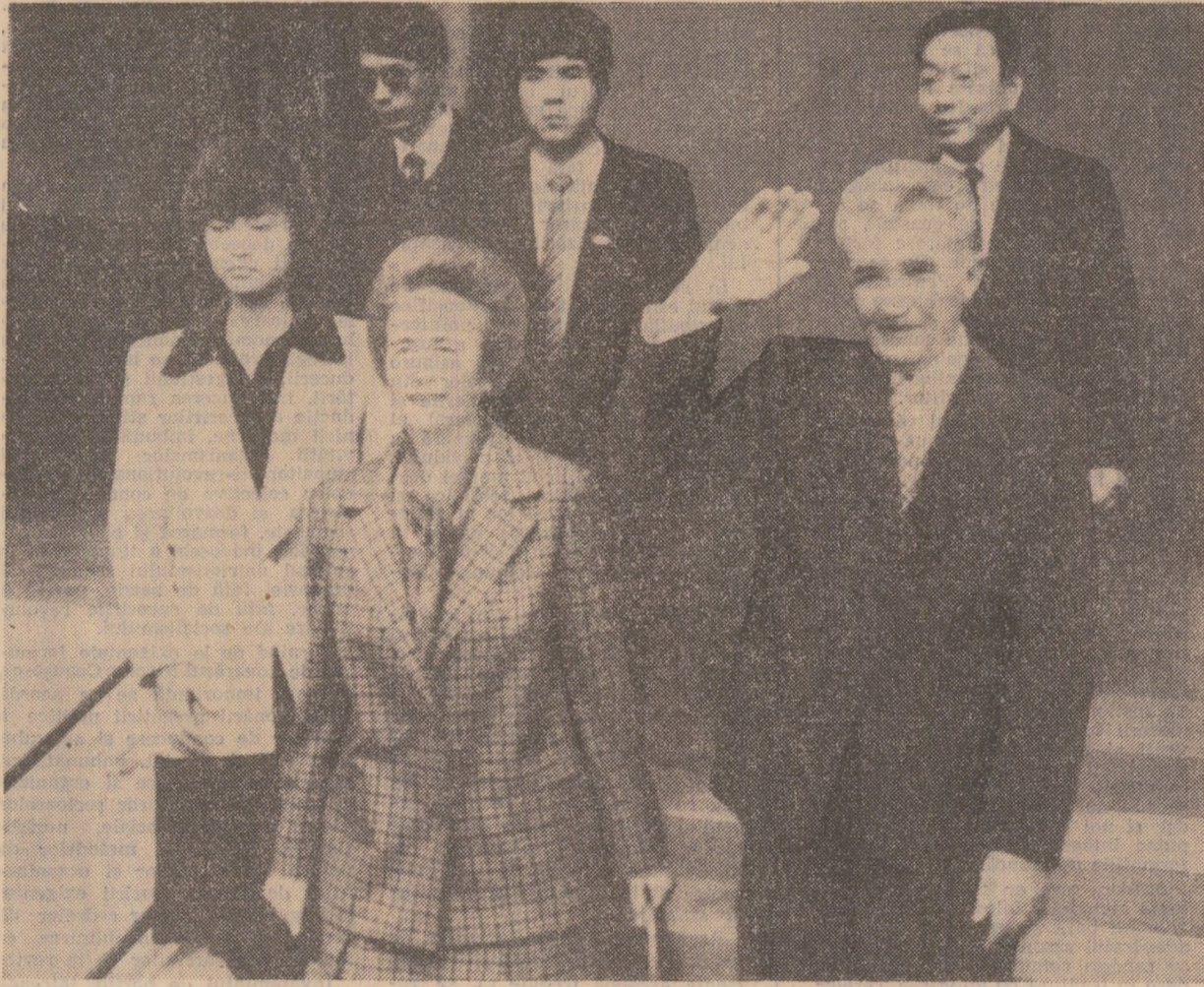
Valori ale culturii și civilizației chineze.

Înălți oaspeți români au asistat la o pitorească prezentare a unor costume de epocă. În timpul vizitei, tovarășul Nicolae Ceaușescu și tovarășa Elena Ceaușescu au apreciat talentul, ingeniozitatea și spiritul constructiv al poporului chinez, creatorul unuia dintre cele mai vechi și strălucite civilizații. În același timp, au fost adresate calde felicitări colectivului de aici, care acționează cu pasiune pentru ca acest așezământ cultural-istoric să evocă, peste timpuri, vechi