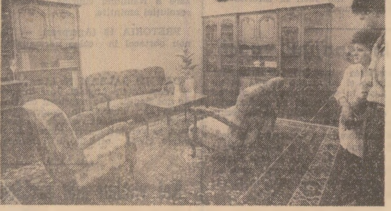
Unul din modelele de mobilier realizate de producătorii români la Târgul Internațional București 1988.