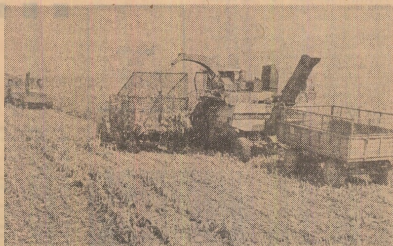
Prețindem, acolo unde mai este de strîns recolta de porumb, trebuie să se acționeze acum cu toate forțele pentru încheierea acestei lucrări.

În toate unitățile agricole, în toate consiliile agroindustriale, analizîndu-se cu maximum de exigență căile și mijloacele de urcare a ritmului de lucru în actuala campanie, au fost stabilite noi măsuri tehnice și organizatorice pentru încheierea, în termenele stabilite, a tuturor lucrărilor. Activiștii comitetului județean de partid, specialiștii direcției agricole județene sînt prezenți în cîmp, mobilizînd lucrătorii ogarilor la cules și transportul produselor. Maximă atenție acordăm încheierii, pînă la sfîrșitul săptămînilor, a recoltării porumbului, lucrare rămasă în urmă în județul Tulcea dacă ținem cont că pe cîmp mai sînt de cules 16.900 hectare. Măsuri deosebite pentru urcarea recoltei porumbului au fost luate îndeosebi în unitățile agricole din consiliile agroindustriale Dăeni, Mihail Kogălniceanu, Topolog și Greci, unde procentul de realizare a lucrării este mult sub media pe județ. Aici, ca și în alte