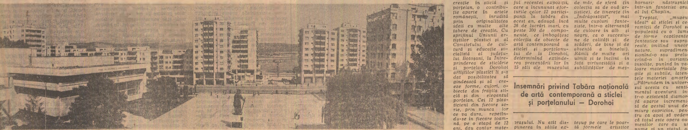
Imagine din municipiul Vaslui.