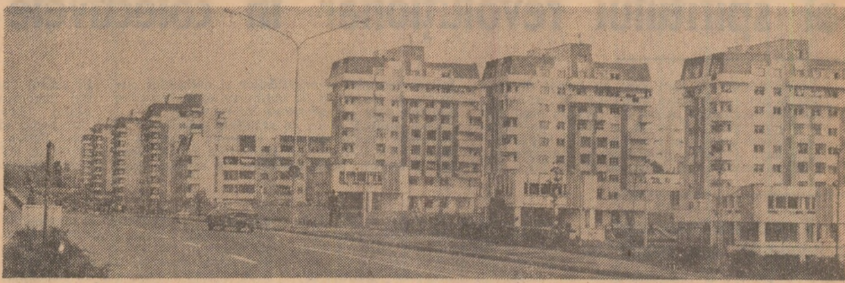
Municipiul Craiova a cunoscut în ultimii ani o impetuoasă dezvoltare urbanistică. Aici s-au construit zeci de blocuri moderne, confortabile.

Ambasadorul australian a exprimat calde mulțumiri președintelui Nicolae Ceaușescu pentru sprijinul ce i-a fost acordat în îndeplinirea misiunii sale în România.